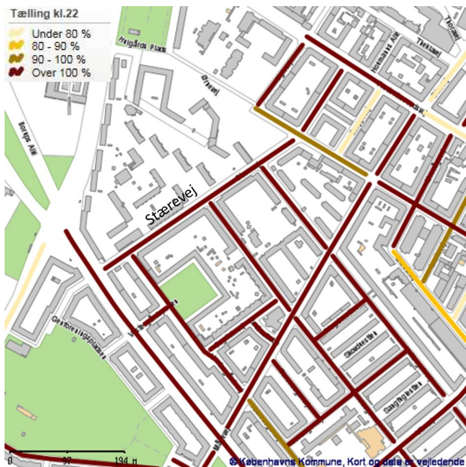
Kort 2: Belægning i området ved seneste tælling kl. 22 (oktober 2017).

Området omkring Fuglekvarteret og Lygten er blandt de områder udenfor betalingsområdet, hvor belægningen er højest. Parkeringspresset må forventes at stige yderligere når Metro Cityringen og den nye Nørrebro Metrostation åbner, såfremt området stadig er uden parkeringsregulering,