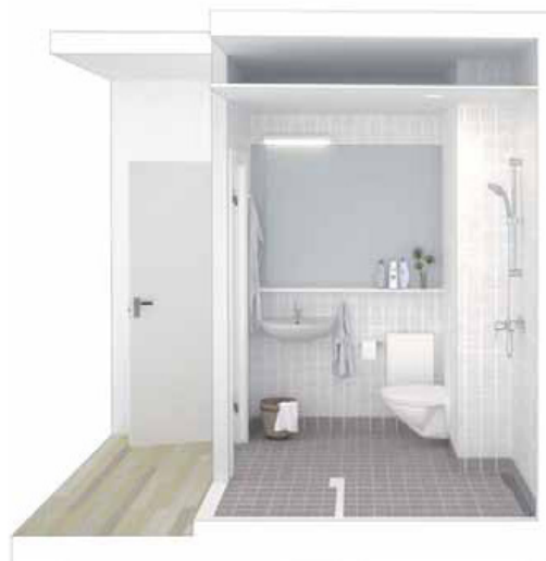
Eksempel på badeværelse efter gennemførelse af helhedsplanen.