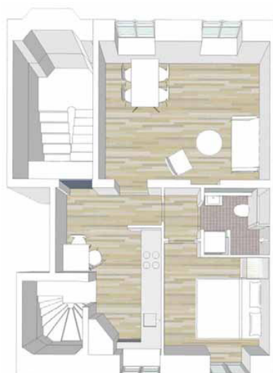
Eksempel på indretning efter gennemførelse af helhedsplanen.