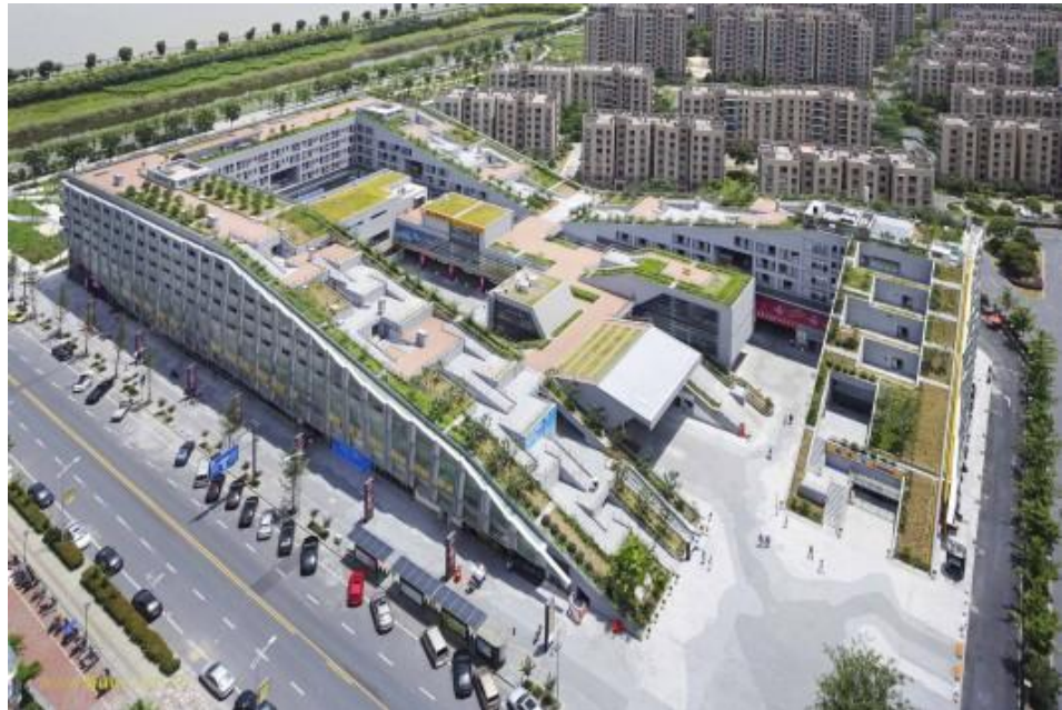
Billedet t.v. er et "mixed-use" projekt fra Hangzhou i Kina (15.700 m 2 boliger og 17.000 m 2 butikker og liberalt erhverv) og illustrerer et vellykket eksempel på et inviterende boligkompleks, med integrerede butikker og adgang til de grønne tage. Arkitekt: BAU Brearley Architects + Urbanists.

En havegruppe vil kunne organisere have dyrkning og pasning af bl.a. komposteringsanlæg, by-bier og drypvanding baseret på regnvandsopsamling (LAR). Beauvais-grunden vil på denne måde kunne danne en overgang mellem haveforeningerne på nordsiden af banelegemet og byen.