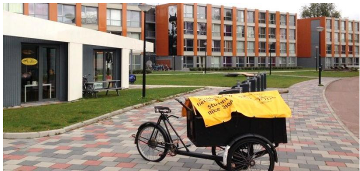
Cykelreparationsværksted som socialt samlende element i Amsterdam

Erhvervslejemålene til de socialøkonomiske microvirksomheder i Urbanias stueetage/ungdomsboligerne skal bygges, så der bliver mulighed for at ændre funktion og indhold over tid.