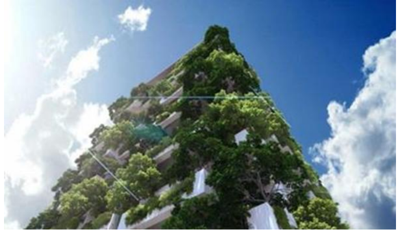
Pasona. Verdens højeste lodrette have(46 etager) i Rajagiriya, Sri Lanka.

hed for virkelig avanceret urban farming. Der kan indhentes faktisk viden om udgifter til etablering og drift i udlandet.