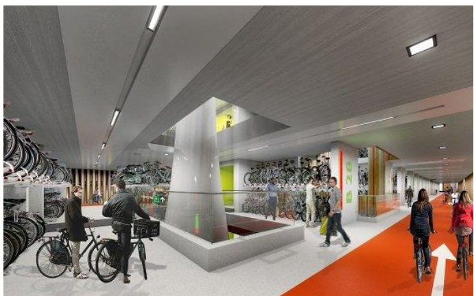
Verdens største indendørs cykelparkering i Holland

SAB og Urbania vil gerne udfordre dette. Projektet vil tænke i tætte og kloge m 2 . Én parkeringsplads med tilkørselsveje optager minimum 25 m 2 . Det er spild af plads i byen. Hvis kommunen vil gå ind på at der dispenseres for parkeringskravet til Urbania kan der blive mere plads og flere anlægskroner til alternativ cykelparkering eller friarealer. Vi tror det er realistisk, fordi der er tæt adgang til kollektiv trafik, og fordi cykelafstanden til den indre by, vandnære og rekreative områder er begrænset. Hertil kommer, at målgruppen for Urbania ikke er privatbilisten. I Tyskland har man gode erfaringer med bofællesskaber med delebiler.