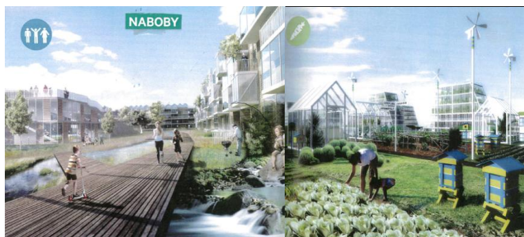
Illustrationer: Affaldssortering fra Internettet samt Billeder af fremtidens Danmark