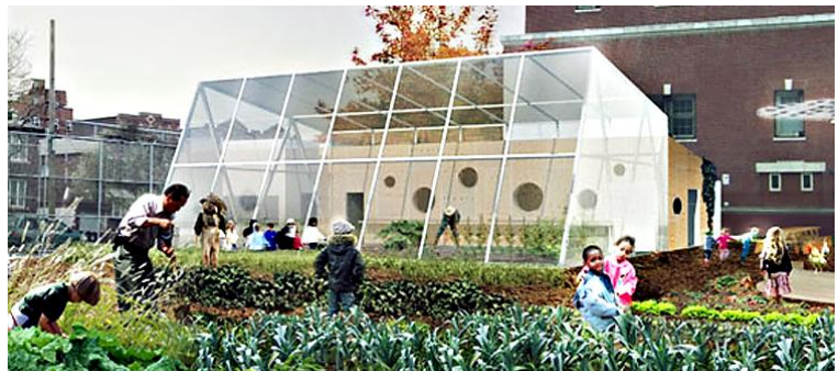
Skolehave i New York

Traditionelt er det legepladsen der er familieboligens sociale centrum. Urbania og ungdomsboligerne kan supplere traditionelle legemuligheder med skolehaver eventuelt på taget, åbent grønt område, byhaver og værksteder. Erfaringerne med udsatte boligområder viser hvor vigtigt det er, at der i et sammenhængende boligområde er forskellige boligformer. Derfor er rækkehusbebyggelsen væsentlig for den sociale balance på Beauvais-grunden.