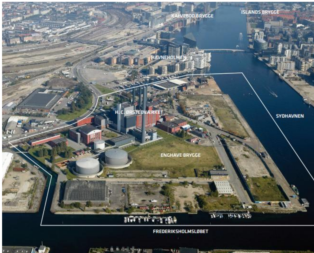
Figur 1 Lokalplanområdet Enghave Brygge

Af lokalplanen fremgår det at følgende matrikler er omfattet: