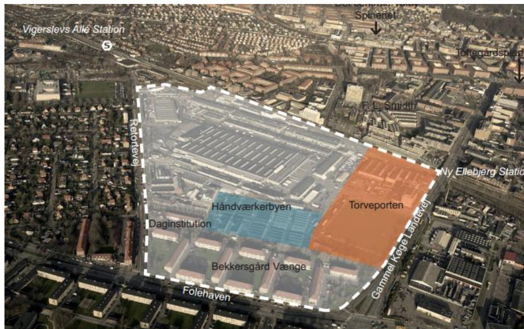
Figur 1 Lokalplanområdet Grønttorvsområdet.

Af lokalplanen fremgår det at følgende matrikler er omfattet: