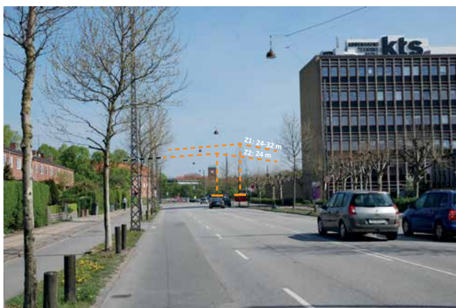
Foto set fra Tuborgvej mod øst med højdegrænser indtegnet. (Illustration: E+N)

MPP (Miljøvurdering af planer og programmer). I forbindelse med udarbejdelsen af lokalplanforslaget foretages en miljøscreening med henblik på at vurdere, om der skal udarbejdes en miljøvurdering af planer og programmer.