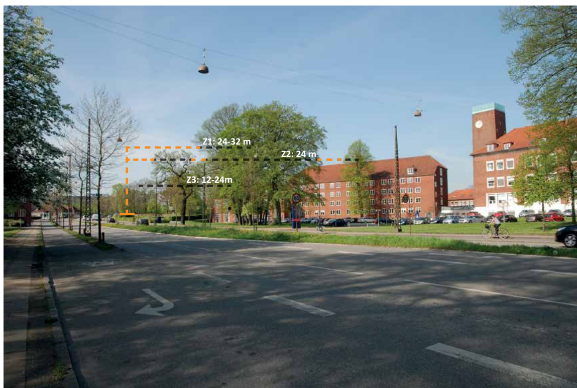
Foto set fra Tuborgvej mod vest med højdegrænser indtegnet.

Københavns Kommunes Arkitekturpolitik har fire hovedmålsætninger, nemlig styrkelse af byens egenart gennem bevaring og udvikling, fremme god og bæredygtig arkitektur, udvikling af nye byrum og urbane landskaber