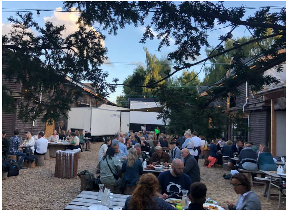
Fællesspisning inden film, Bio-Bio 2020. Grundet COVID-19 forsamlingsforbud måtte vi have 100 gæster.

Størstedelen af aktørerne på listen er vi i dialog med. Det endelige filmprogram skal på plads, før vi kan udarbejde det endelige program og tilføje ydeligere indslag