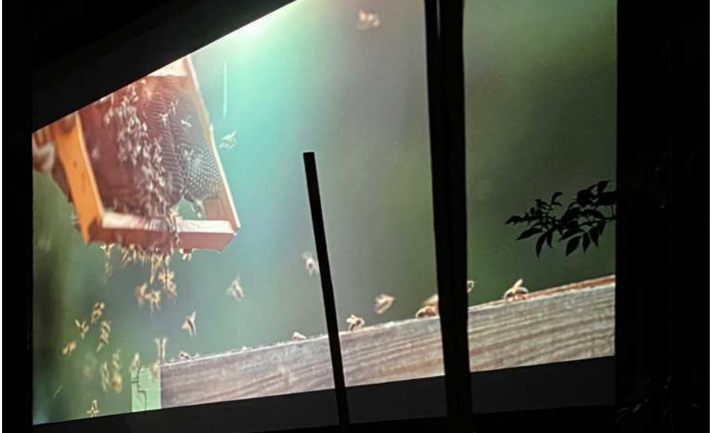
Bio-Bio 2020. Billede fra udendørs lærred. Dokumentarfilmen Honeyland

Venligst se finansieringsplan. Denne såvel som rækken af samarbejdspartnere vil afspejle bredden i projektet.