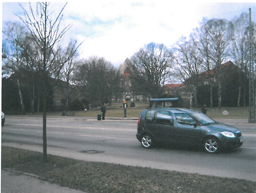
Foto 2. Udsyn mod Grundtvigs Kirke set fra Vestre Længdevej