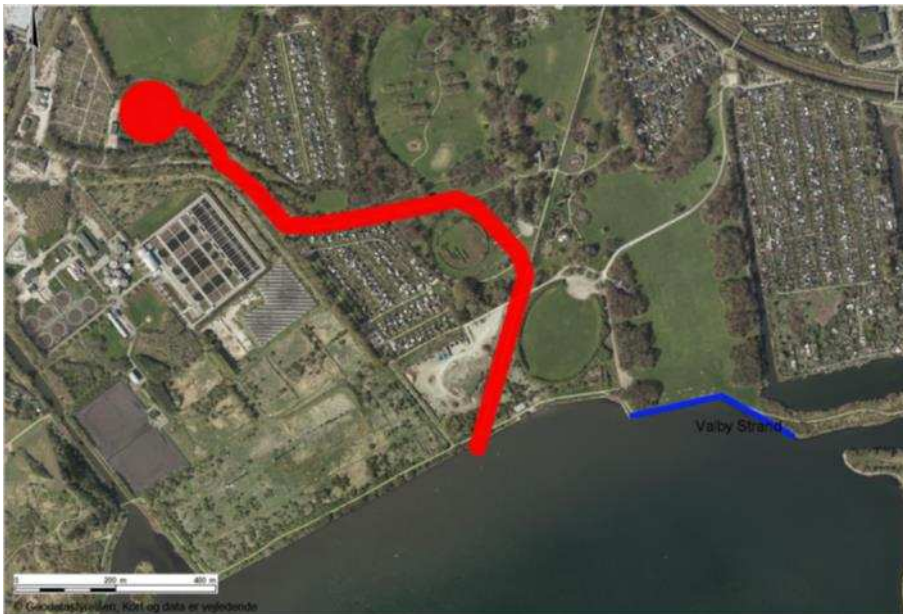
Figur 1. Den røde streg viser forslaget fra den oprindelige skybruds-konkretisering. Bredden på den røde streg angiver cirka bredden på skybrudsløsningen.

udvidelsen af tunnelprojektet svarer til de estimerede omkostninger for overfladeprojektet. Der bliver således ikke forøgede omkostninger som følge af skiftet i løsningstype. Det skal bemærkes, at beregningen af omkostningerne for begge projekter er foretaget i den indledende projektfase, hvorfor der kan forekomme mindre variationer i omkostningerne i forhold til fremtidige beregninger. Der mangler flere forundersøgelser før den endelige beslutning kan foretages. Medfører forundersøgelserne, at prisen bliver væsentlig dyrere, vil et nyt forslag blive udarbejdet.