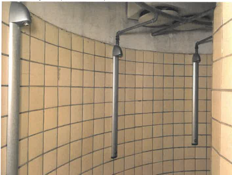
Foto 6. Drenges bad. Råddent vindue