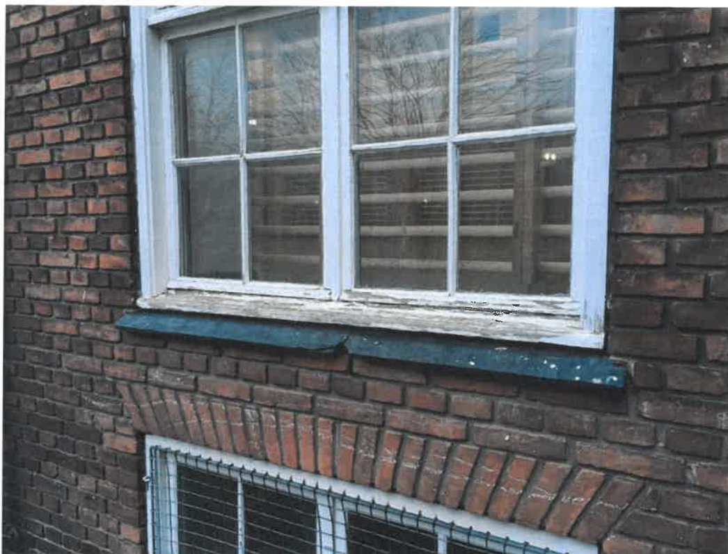
Foto 2 Rådden bundkarm