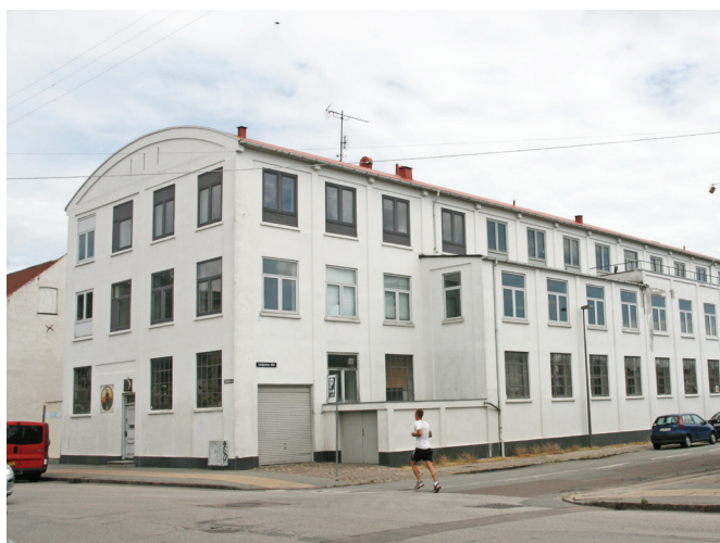
Lindgreens Allé 5. En karakteristisk bygning i område som forudsættes bevaret.

Københavns Kommunes arkitekturpolitik og egenartsanalysen af kvarteret danner baggrund for de krav, der stilles til den nye bebyggelses udformning. Målet er, at bebyggelsen udformes som en nyfortolkning af stedets egenart og tilfører kvarteret nye arkitektoniske, byrums-