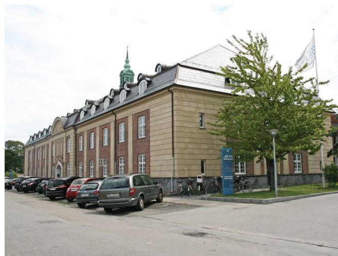
Lindgreens Allé 12. Gyldendals tidligere administrationsbygning er udpeget som bevaringsværdig.

Bebyggelsesstrukturen skal være med til at give gode opholdsmuligheder i solen og læ for vinden.