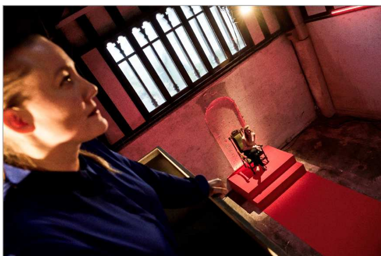
Forestillingen: MARIA STUART