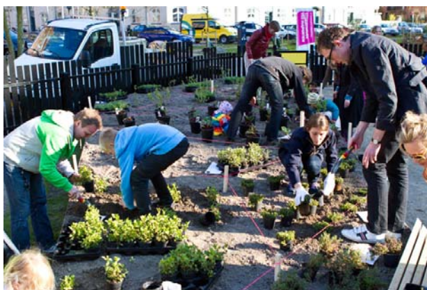
Frivillige i gang med etableringen af storbyhaven Majporten.

Ressourcer: Økonomi og personaleressourcer indenfor eksisterende budget i TMF.