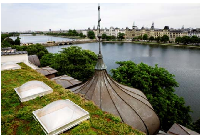
En klimatilpasningsløsning i form af et grønt tage ved Søerne i København.

Ressourcer: Økonomi og personaleresourcer indenfor eksisterende budget i TMF samt særskilt bevilling til partnerskaber (Budget 2015).