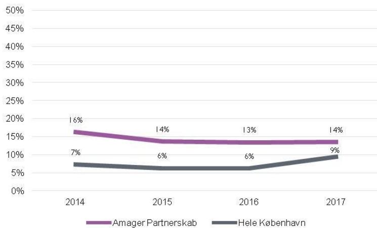
Figur 2: Andel utrygge i Amager partnerskab (2014-17)

I aften- og nattetimerne er der et fald fra 28 % (2016) til 26 % (2017), i andelen af utrygge. Der kan dog ikke på vises en statistisk signifikant udvikling. Andelen af utrygge i aften- og nattetimerne i partnerskabsområdet er i 2016 højere end gennemsnittet for hele byen (22 %). Målet om at nærme sig Københavnniveau i andelen af utrygge i aften- og nattetimerne er dermed nået, idet dette niveau er steget til 22 %, mens andelen af utrygge i partnerskabsområdet tilsvarende er faldet til 26 %.