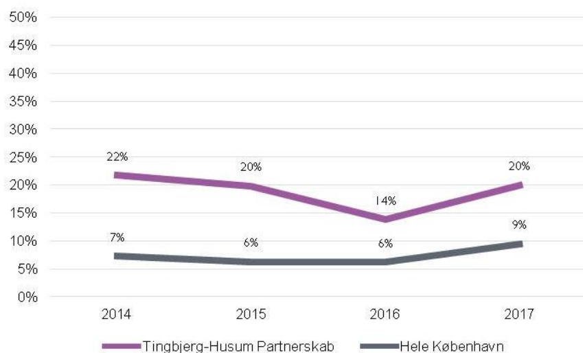
Figur 2: ANDEL UTRYGGE I TINGBJERG-HUSUM PARTNERSKAB (2014-2017)

Tryghedsundersøgelsen 2017 indikerer et fald i andel utrygge i aften- og nattetimerne fra 36 % i 2016 til 32 % i 2017, og et fald fra 35 % i 2014 (Figur 3). Udviklingerne er ikke statistisk signifikante og kan dermed være udtryk for statistisk tilfældighed. Andelen af utrygge i aften og nattetimerne i partnerskabsområdet er i 2017 højere end gennemsnittet for hele byen (22 %). Det bemærkes dog, at udviklingen er positiv ift. målsætningen, idet at andelen af utrygge i aften og nattetimerne i partnerskabsområdet nærmer sig københavnerniveau.