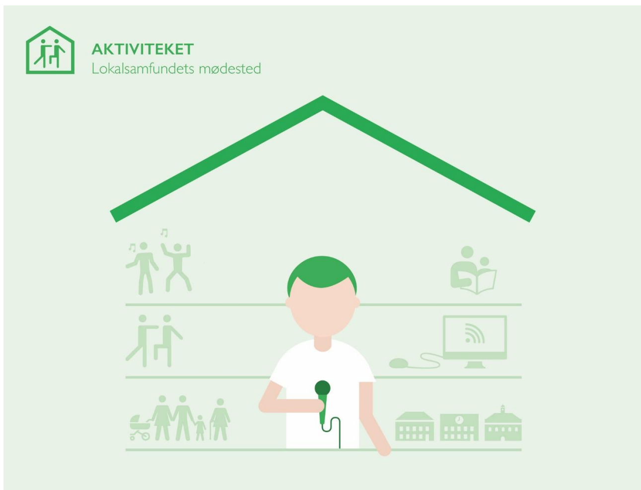
Figur 5: Aktiviteket er ramme om lokale aktiviteter, som primært arrangeres af frivillige borgere.

Indholdet i Aktiviteket er høj grad afhængig af, hvad borgerne i lokalområdet interesserer sig for og har brug for. I et lokalområde med mange børnefamilier vil Aktivitet tilbyde mange arrangementer rettet mod børn og forældre. Bibliotekstilbuddet i Aktivitekerne rundt omkring i byen ser altså vidt forskellige ud og rummer store lokale forskelle.