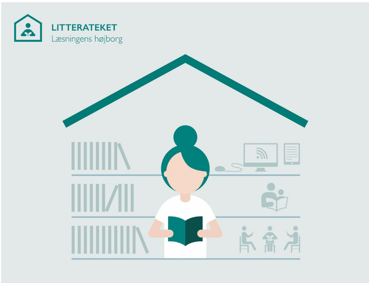
Figur 4: I Litterateket satser biblioteket systematisk på læsefærdigheder og stimulering af læselyst.

Med litteraturen i centrum satser Litterateket ikke på opsøgende virksomhed af kulturel eller social karakter, med mindre de er med til at styrke læsefærdigheder eller fremme litteraturen. Der oprettes boghjørner og pop-up biblioteker i byen, der supplerer Litteratekets fysiske huse.