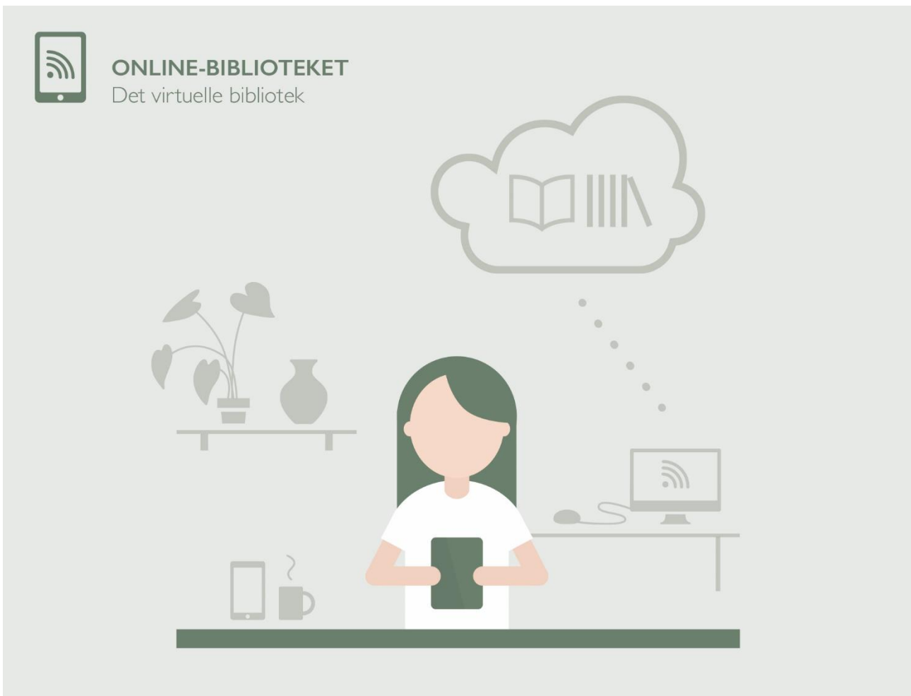
Figur 6: I Online-biblioteket findes materialer kun digitalt, og det fysiske bibliotek er nedlagt.

Driftsudgifter kan reduceres betydeligt, da de fysiske biblioteker kan afhændes og medarbejderbestanden beskæres. Der er nemlig kun behov for en mindre gruppe medarbejdere, der kan varetage udvikling og drift af digitale søge- og anbefalingstjenester. Online-biblioteket er et pejlemærke for en langsigtet udvikling og gradvis migration fra et fysisk til et fuldt digitaliseret bibliotek. Udviklingen af en folkeoplysende algoritme er en forudsætning for, at Online-biblioteket kan realiseres.