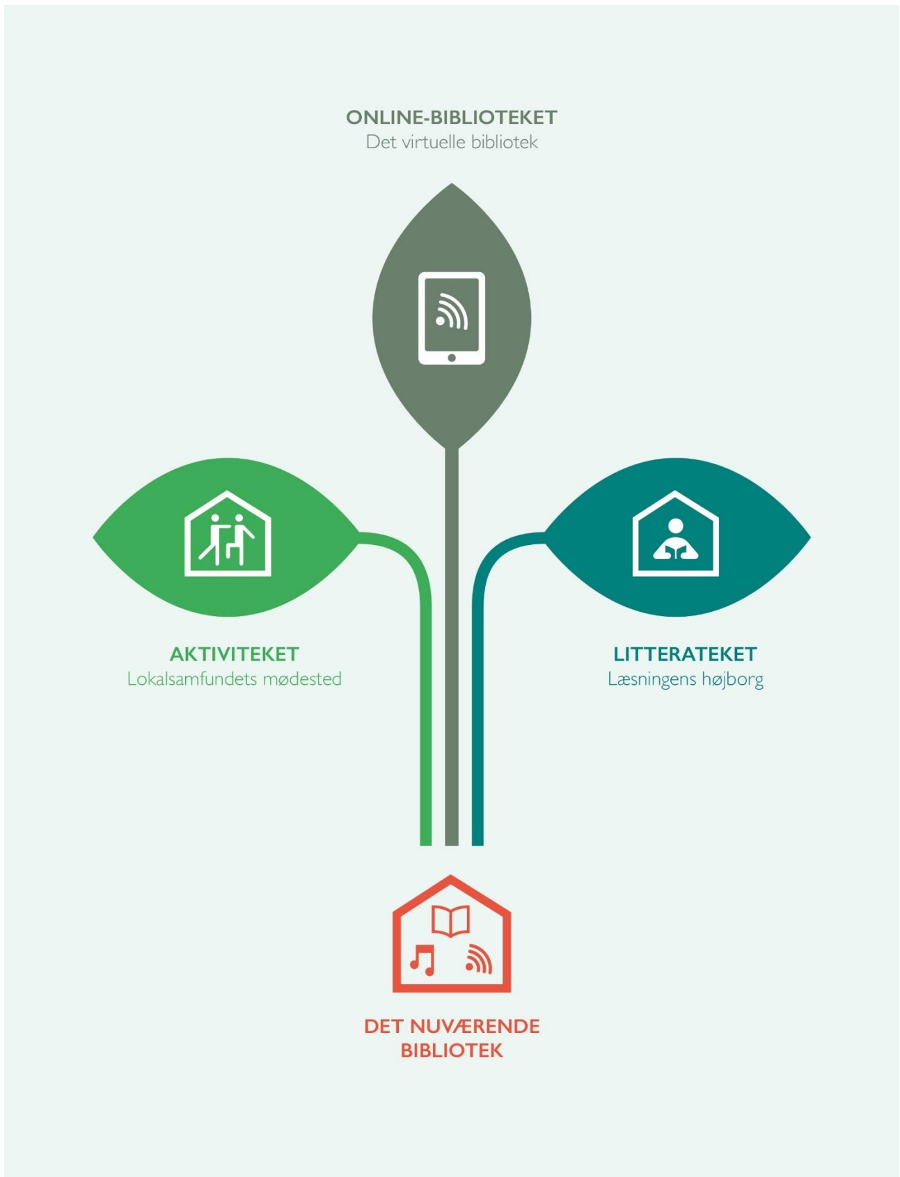
Figur 1: Scenarier for den fremtidige kerneopgave.