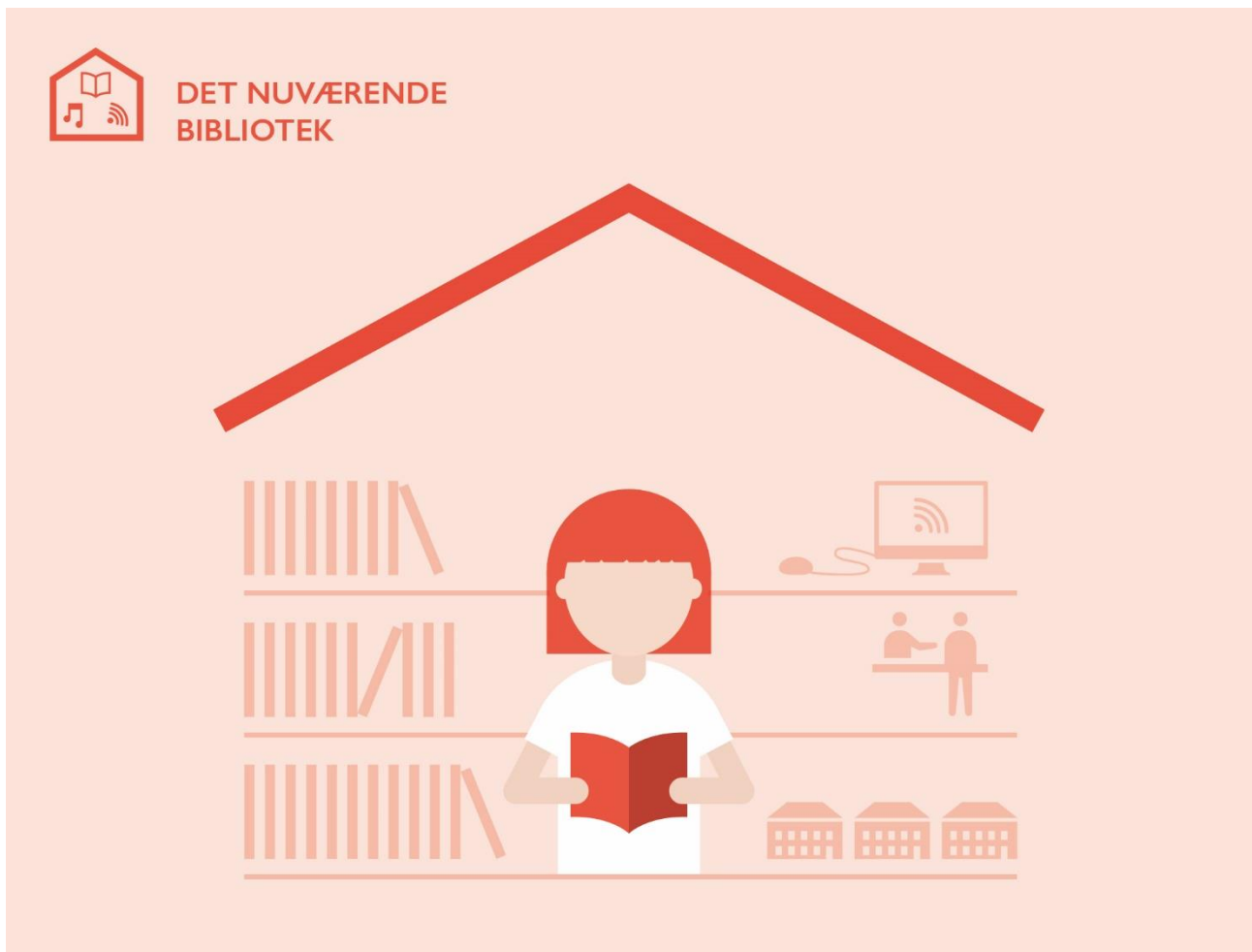
Figur 2: I det nuværende bibliotek falder udlånet af fysiske bøger, mens e-udlånet og besøgstallet stiger.

I det nuværende bibliotek satser man på øget samarbejde på tværs af de 20 biblioteker i København bl.a. gennem en række fælles indsatser rettet mod førskolebørn samt skolebørn og unge. Med øget samarbejde forsøger bibliotekerne at udvikle et bedre bibliotekstilbud for flere københavnere. Også udviklingen af det digitale bibliotek er højt prioriteret.