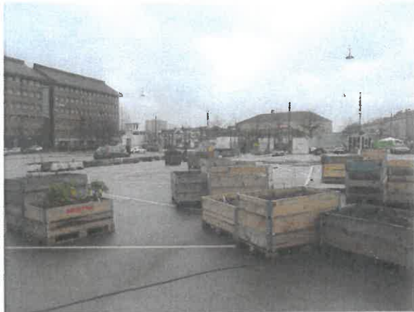
Toftegårds Plads set fra Kulturhuset