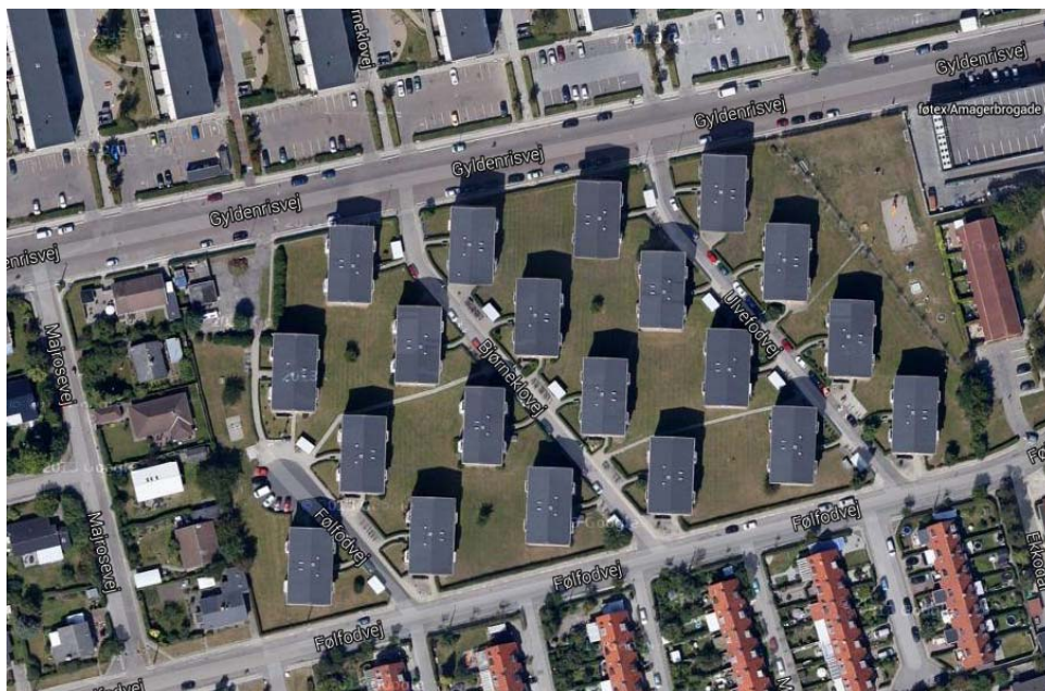
Figur 2 Bebyggelsen AAB Afd. 111 Parkskellet, luftfoto

Parkskellet rummer 239 boliger, fordelt på 20 boligblokke i tre etager (høj stueetage samt 1. og 2. sal). Alle tre etager har ens etageplaner, med fire små 3-værelses lejligheder på ca. 59-61 m 2 centreret omkring et trapperum pr blok. Hver blok er 744 m 2 . Der er ikke fælles beboerlokaler for afdelingen.