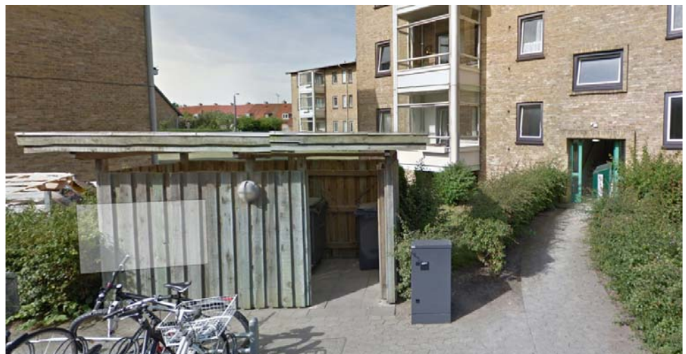
Figur 9 Eksisterende affaldsskur i Parkskellet. Skuret (formentlig af trykimprægneret træ) er placeret på fliser og med stort udhæng. Et tilsvarende skur kan laves af gran funderet på punktfundamenter af beton. Skuret skal holdes fri af beplantning, både buske og klatreplanter.

Uanset om man anvender lærk eller gran, er konstruktiv træbeskyttelse i opbyg-ningen af konstruktionerne helt afgørende for træets levetid. Det betyder bl.a., at regn og opsprøjt, som rammer træet, skal kunne ledes væk hurtigt så træet kan tørre igen. Konstruktionerne skal friholdes fra jord, f.eks. ved at fæstnes i et stålbe-slag ned i et punktfundament af beton. Facadebeklædningen skal holdes fri af jor-den, tagudhæng skal beskytte beklædningen og der skal være luft omkring bygge-riet. Se i øvrigt figur 5.