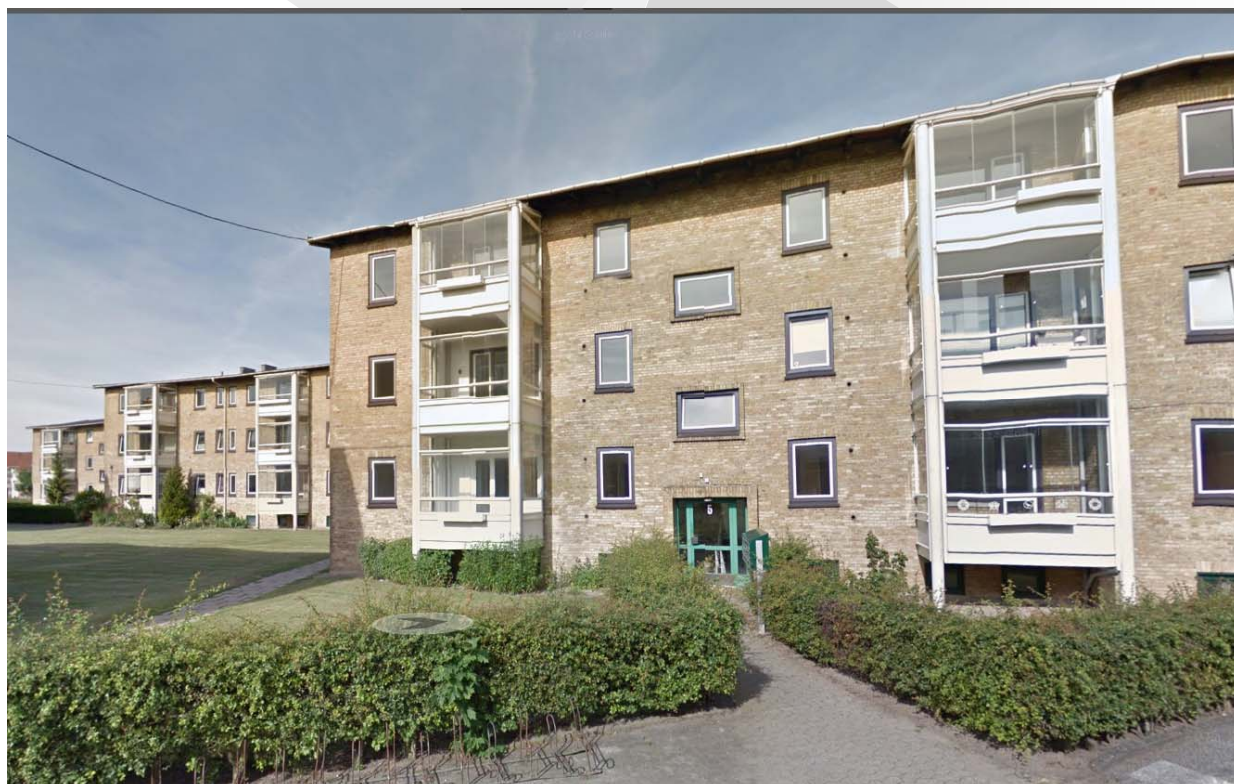
AAB AFD. 111 PARKSKELLET

CASESTUDIE: TOTALØKONOMISK ANALYSE AF MBA16 KRAV TIL RENOVERING AF ALMENE BOLIGER