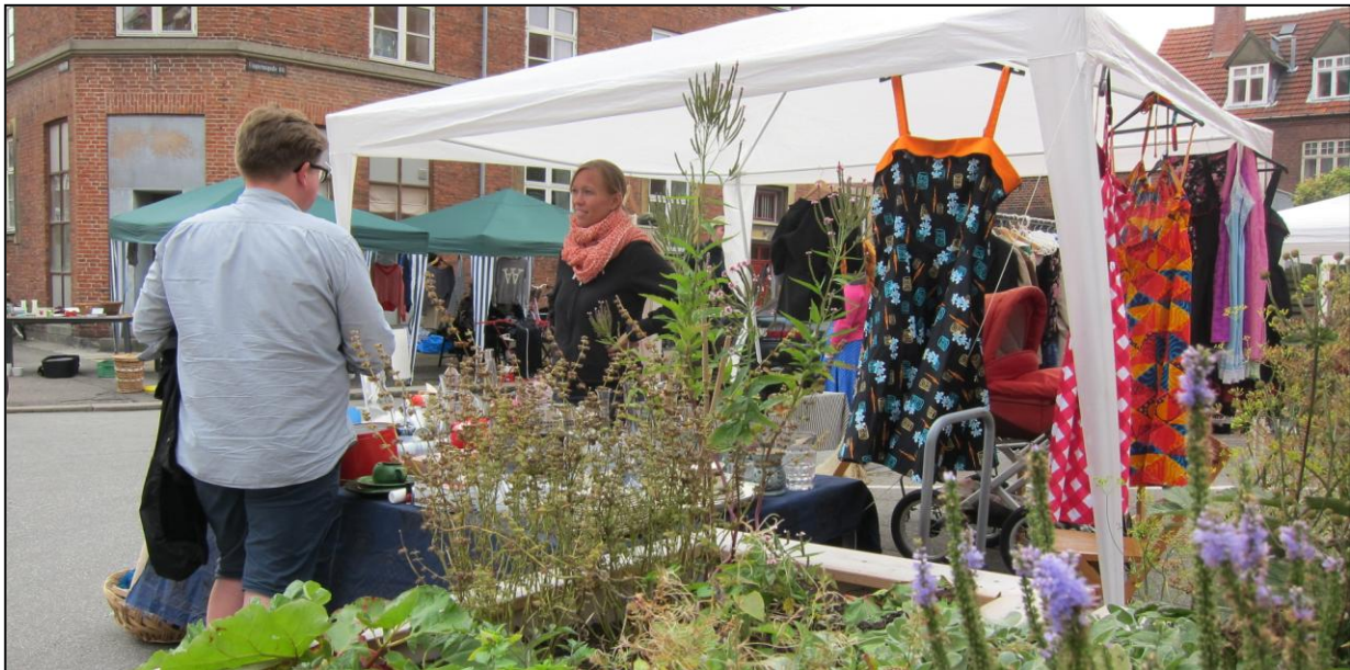
Loppe- og byttemarked i Ungarnsgade

Ungarnsgadenetværket er et gadebaseret netværk, der arbejder med at gøre Ungarnsgade til et grønnere og bedre sted at bo. De har i år bygget gadehaver, arbejdet for at forskønne vejens bede, holdt et loppe- og byttemarked, undersøgt muligheden for delebiler i gaden, en fælles storskraldsordning og for mere liv i de tomme butikslokaler og endelig er netværket i gang med at undersøge muligheden for at blive et vejlaug, så de kan få større indflydelse hos kommunen i forhold til vejens udformning.