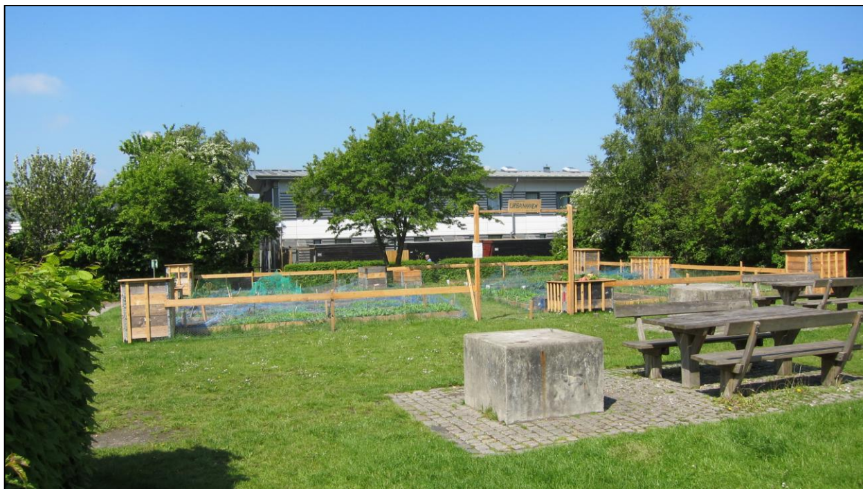
Urbanhaven i Remiseparken

På den internationale byhavekonference 'Eat Your City' har vi sat fokus på de potentialer og udfordringer, der relaterer sig til byhaver og bylandbrug, skolehaver og byhaver som social sammenhængskraft. Miljøpunkt Amager vil følge op på erfaringer fra konferencen ved blandt andet at gå i dialog med Københavns Kommune om, hvordan rammerne for den spiselige by kan forbedres.