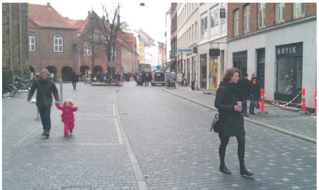
Referencefoto fra Landemærket, der er udformet efter de samme principper som foreslået anvendt på Sankt Annæ Plads..

Der arbejdes med let sænkede enkeltrettede kørespor med en bredde på ca. 3,25 m, hvilket vil medføre at bilister oftest vil blive bag cyklisterne, men med mulighed for at en cyklist eller en bilist kan passere den anden part, hvis denne er standset op, eller færdes meget langsomt.