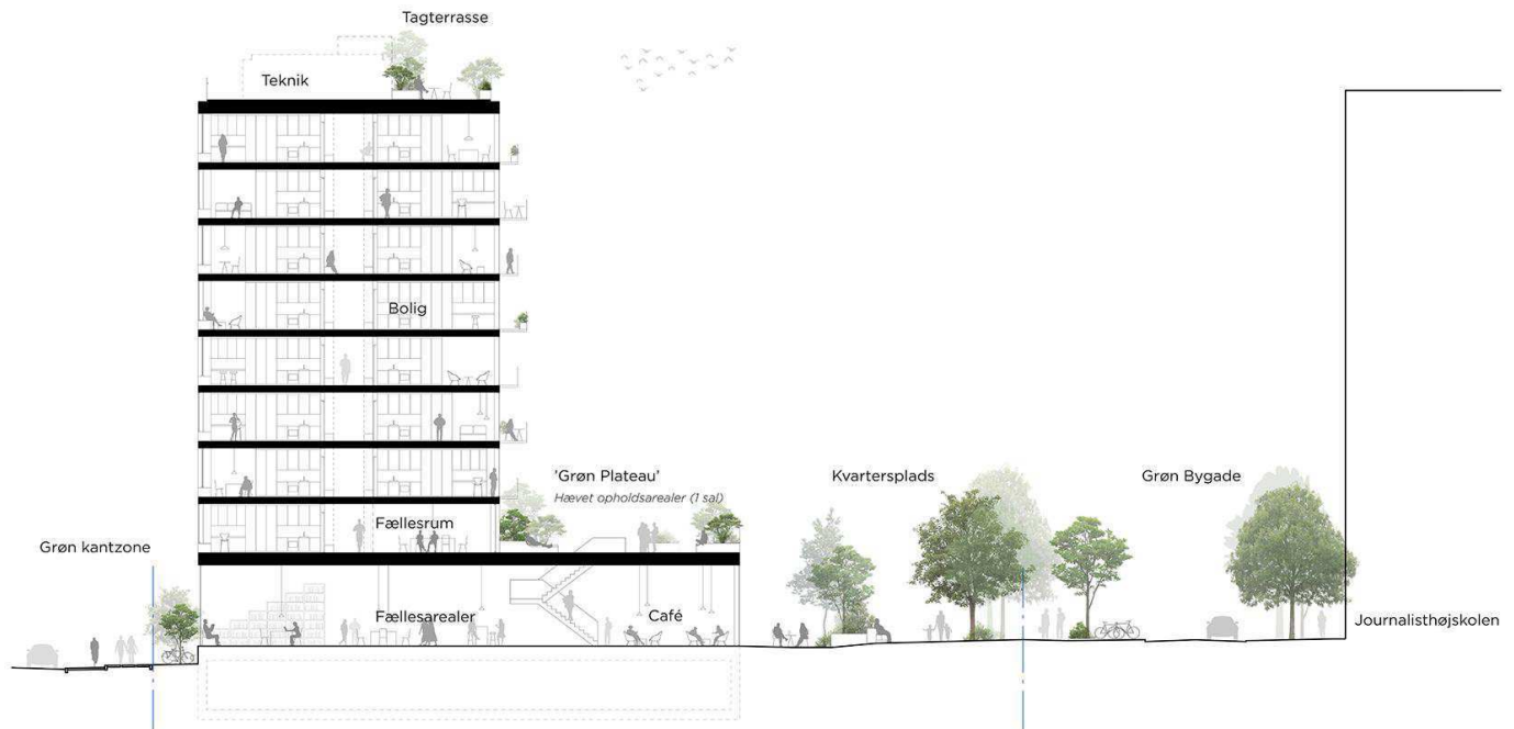
Snit, der viser et eksempel på nybyggeri. Illustration: EFFEKT.