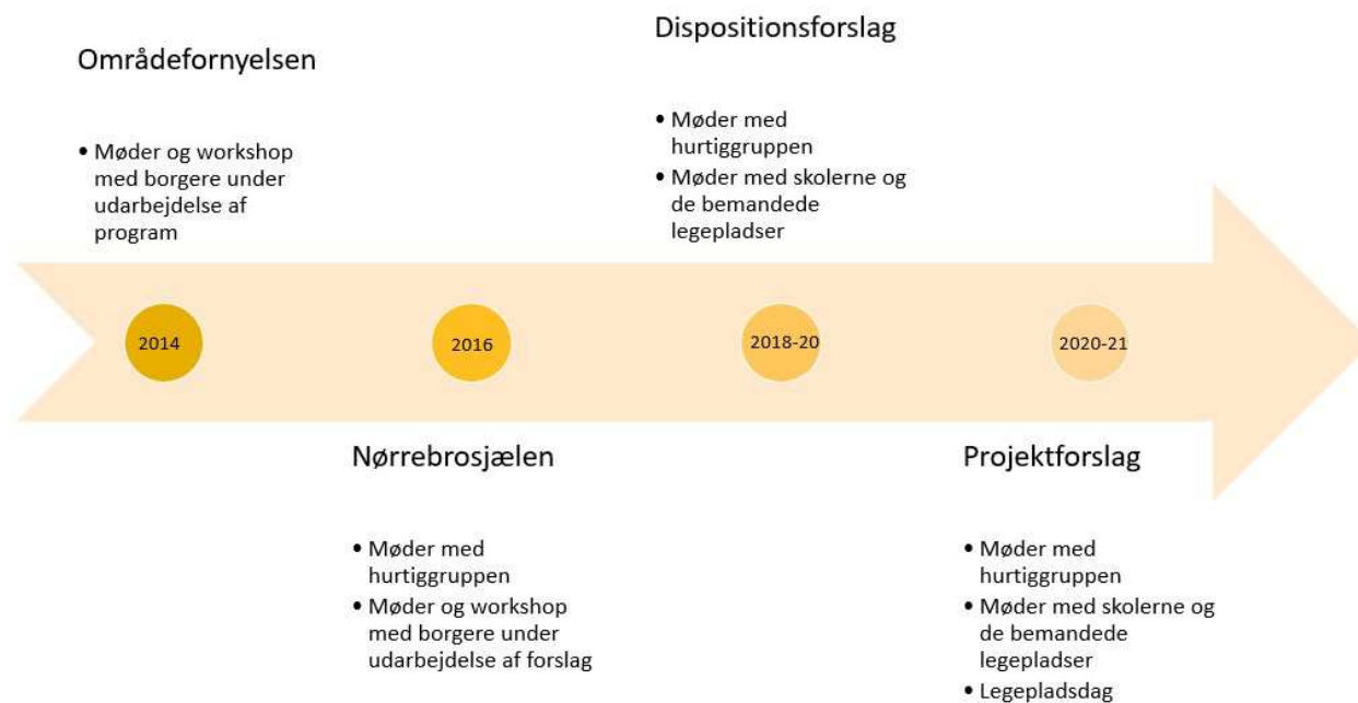
Figur 2 - Oversigt over inddragelse af borgere og interessenter i Hans Tavsens Park projektet.

eleverådets kommentarer. Desuden deltog en medarbejder fra indskolingene, som blandt andet kom med vigtige input om elevernes behov for at krydse Mellemløbet i skoletiden.