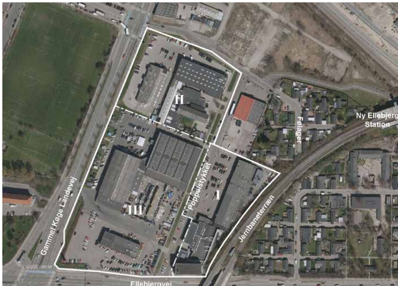
Lodfoto af området og dets omgivelser. Lokalplan området er vist med hvid bræmme. Lokalplanområdet indgår i et større byomdannelsesområde, som omfatter Ny Ellebjerg Station, Grøntorvet, F. L. Smidth m.v.

Lokalplanområdet indgår i det store byudviklingsområde "Ny Ellebjerg-området" og "Grøntorvsområdet", for hvilke der er vedtaget lokalplaner og nye lokalplaner er på vej. Poppelstykket vil blive et vigtigt bindeled fra stationen til Valby Idrætspark.