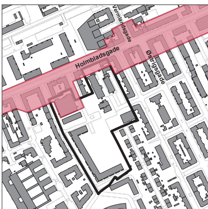
Detailhandlsrammer i Kommuneplan 2011

Der er i henhold til Kommuneplan 2011 muligheder for at etablere detailhandel i området inden for Amagerbrogade Bymidte langs Holmbladsgade og Mechlenborggade.