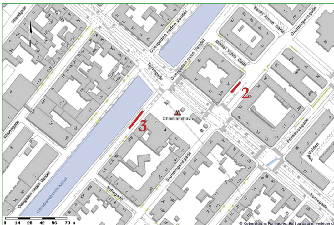
Kort 3: Nedlæggelser i grøn zone

De lokaliserede pladser i rød og grøn zone nedlægges medio 2014, mens de resterende først nedlægges primo 2015.