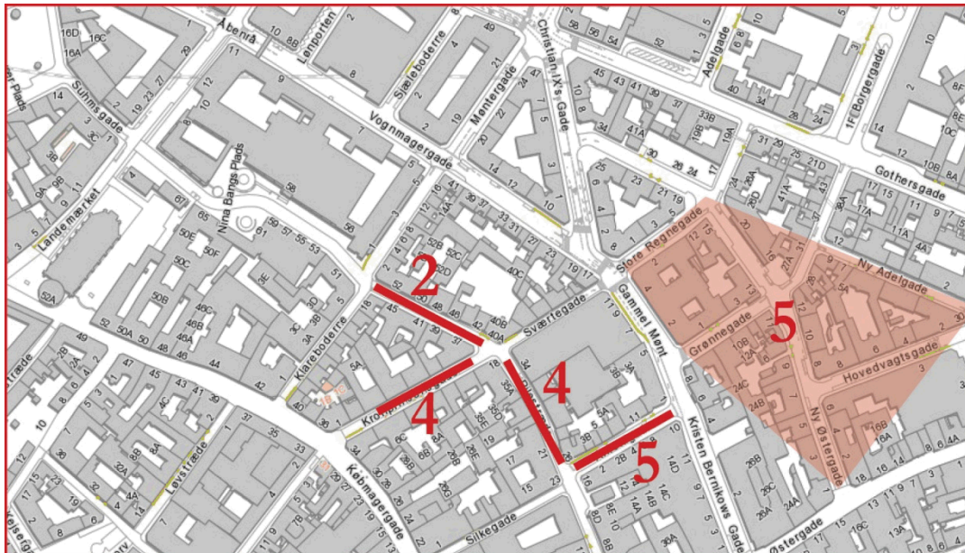
Kort 2: Nedlæggelser i rød zone