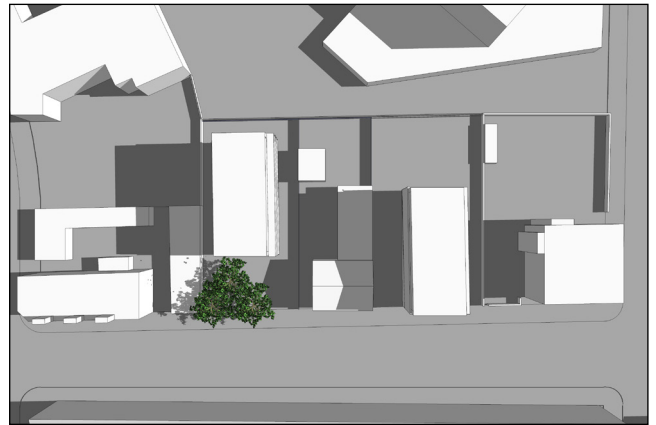
21. juni kl. 9:00