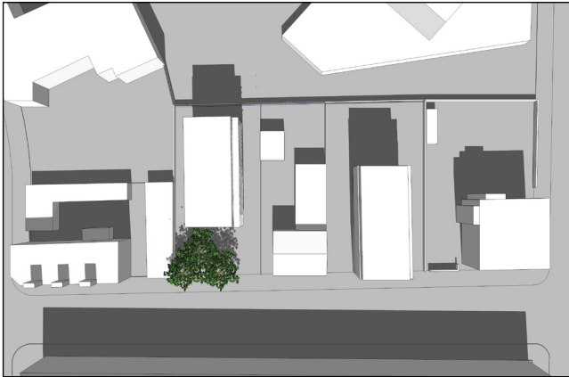
21. marts kl. 12:00