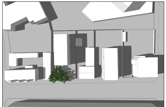
21. juni kl. 16:00