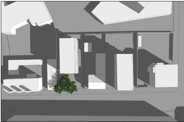
21. marts kl. 9:00