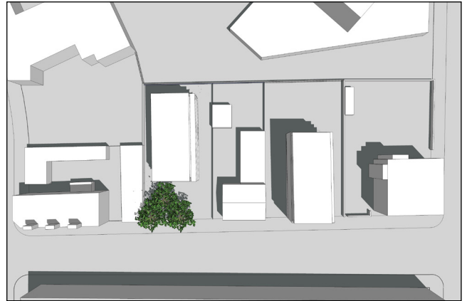
21. juni kl. 12:00