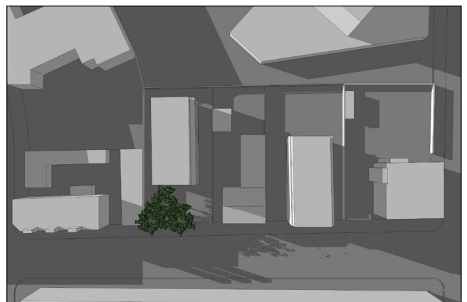
21. juni kl. 19:00

Skyggediagrammerne viser, at der vil være skyggedannelse, der berører naboejendomme, herunder klosteret, mod vest og nordvest om morgenen ved sommarsolhverv og jævndøgn, samt mod nord og øst om eftermiddagen ved jævndøgn og sommarsolhverv. Naboejendommen mod vest, Sigurdsgade 25, berøres af skygger primært om morgenen ved sommarsolhverv, og naboejendommen mod øst, Titangade 7, berøres af skygger om eftermiddagen ved jævndøgn og sommarsolhverv.