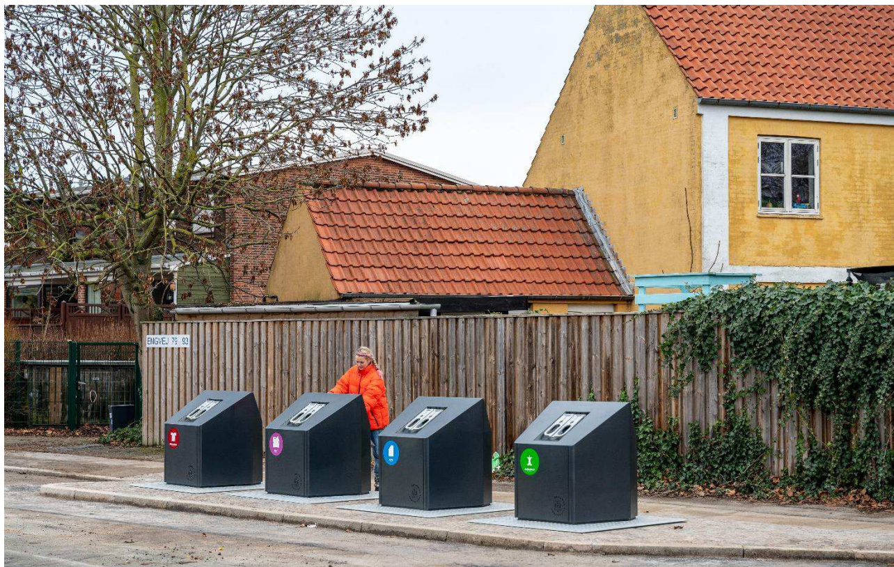
Sorteringspunkt på Amager Øst med fire nedgravede beholdere. Anlagt i januar 2023.