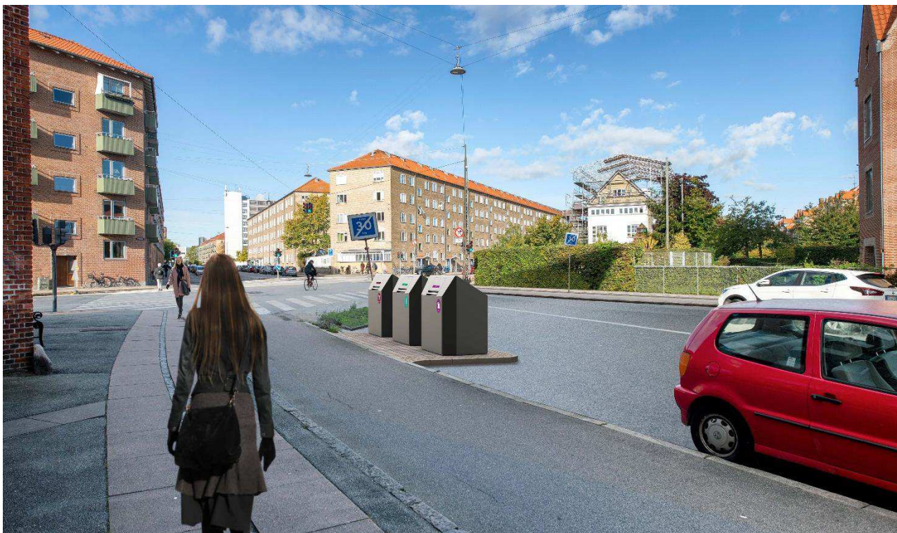
Eksempel på sorteringspunkt med tre kuber. Placering samt udformning af affaldsløsninger og anlæg er ikke nøjagtig gengivelse af, hvordan et sorteringspunkt kommer til at fremstå.