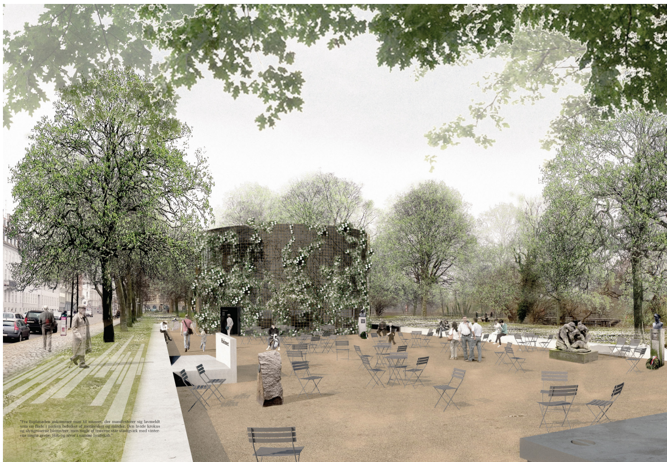
Visualisering af projektet set fra vejen Churchillparken mod vest. Ill. Lundgaard & Tranberg Arkitekter.

Bygningen foreslås udformet som en elipseformet bygning med fladt tag og i øvrigt med et afdæmpet /stilfærdigt arkitektonisk udtryk der tilpasses det særlige kulturmiljø. Materiale-mæssigt tænkes bygningen at fremstå med espalier på facaderne i dialog med/integreret/relateret med/til parkens beplantning og i kontrast til Frederiksstadens bygninger. I projektet suppleres med træbeplantning mod hjørnet Churchillparken/Esplanaden. Vigtige sigtelinjer til og fra kastellet bevarer. Cykelparkering foreslås placeret henholdsvis mod Churchillparken og Esplanaden.