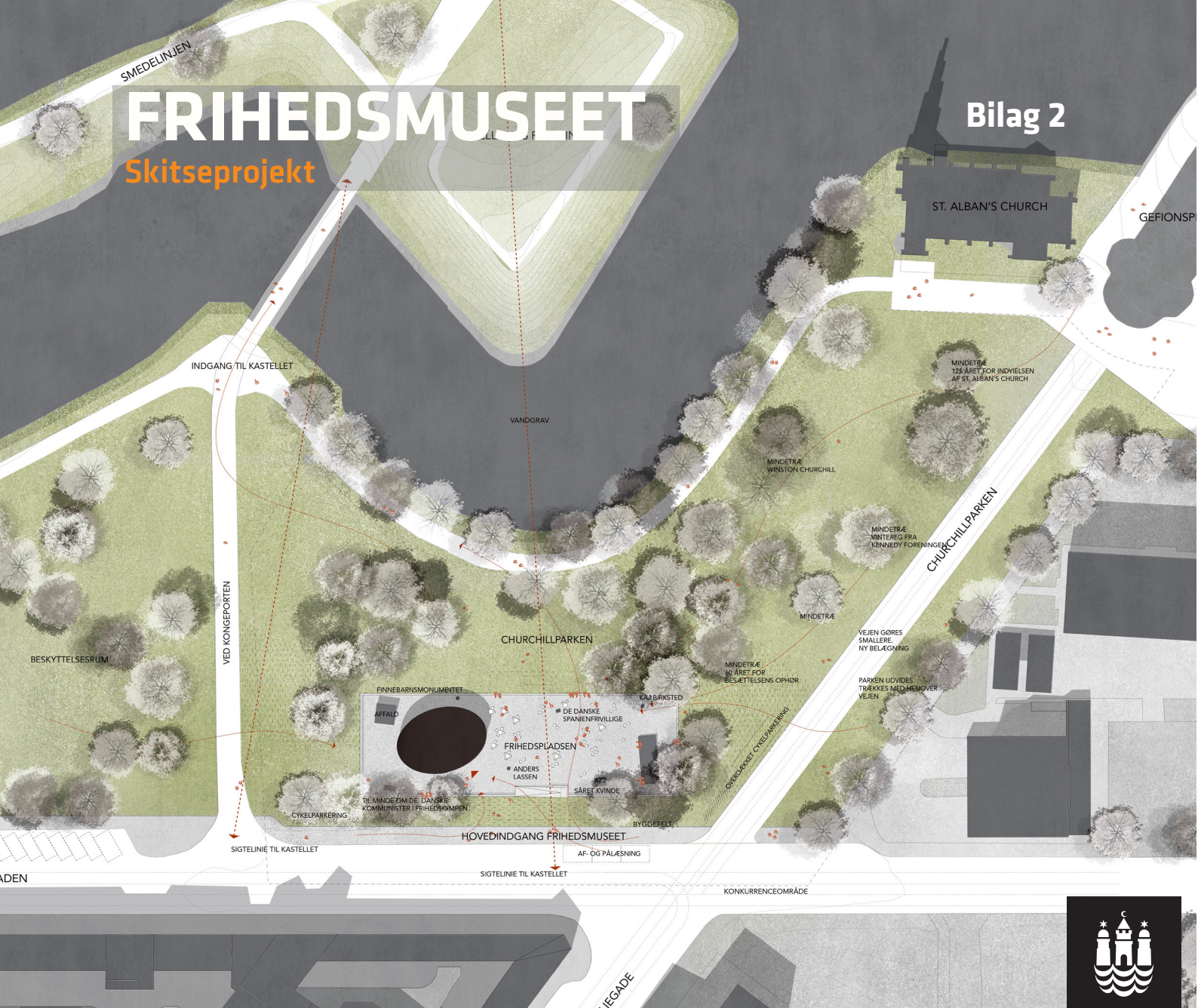
Situationsplanen viser den nye bebyggelse med en ellipseformet ankomstbygning placeret på et nedsænket grusbelagt felt i det sydøstlige hjørne af Kastelet. Ill. Lundgaard & Tranberg Arkitekter.