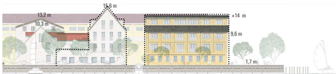
Eksempel på nyt byggeri markeret med stiple. Projekt på Wilders Plads 9 (tv) og 11 (th) med gavl og facade mod sydvest, set fra Wilders Kanal. Bygningshøjder er angivet i koter - terræn er i kote 1,7. Illustration: Lundgaard & Tranberg Arkitekter.