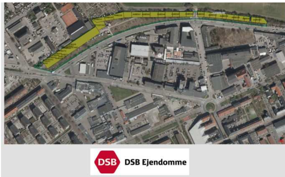
Bilag 1. Ejerforhold 2018. Den grønne streg markerer grunden.