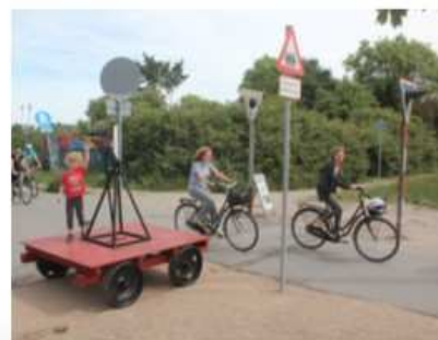
Stemmingsbillede og visuel forståelse