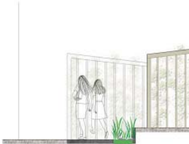
Skitse af illustrativ karakter af konstruktion cykelparkering med klatreplanter op ad sider og tag og særlig "v" belægning langs midte af gård.