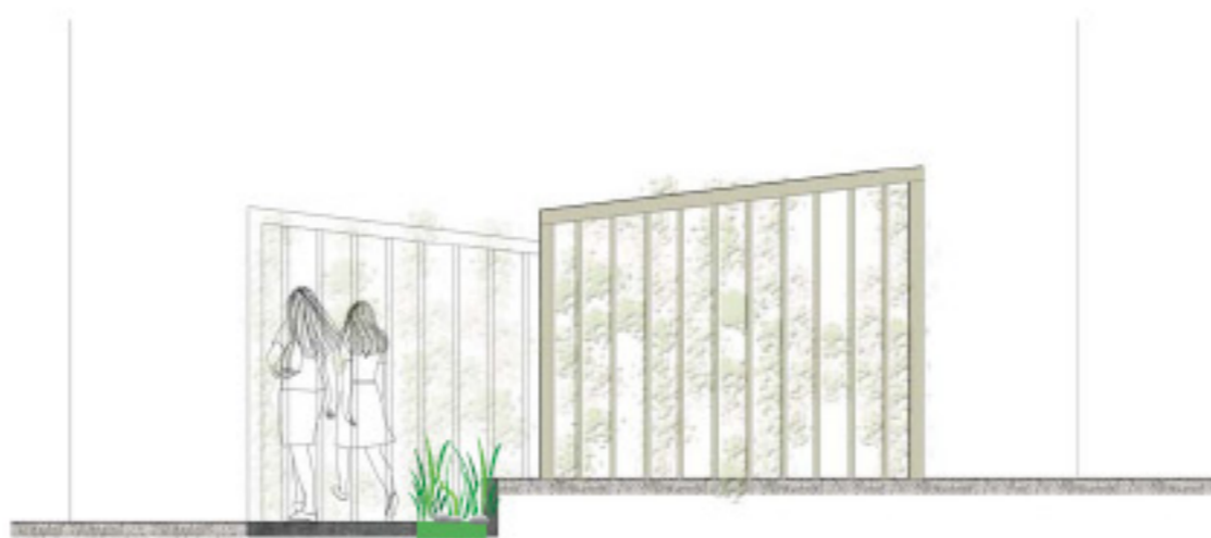
Skitse af illustrativ karakter af konstruktion cykelparkering, renovation med klatreplanter op ad sider og tag og særlig "udsmykning" i belægning langs midte af gård.