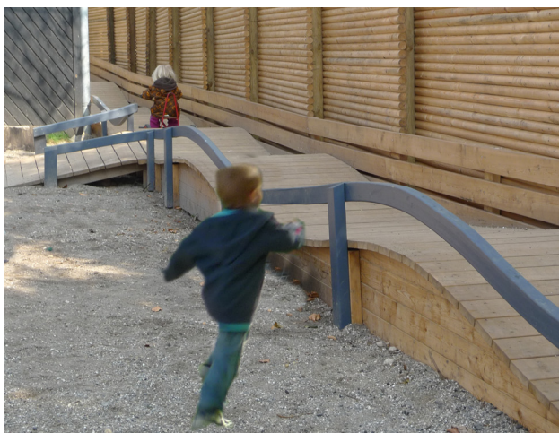
Inspiration til den fremtidige gårdhave