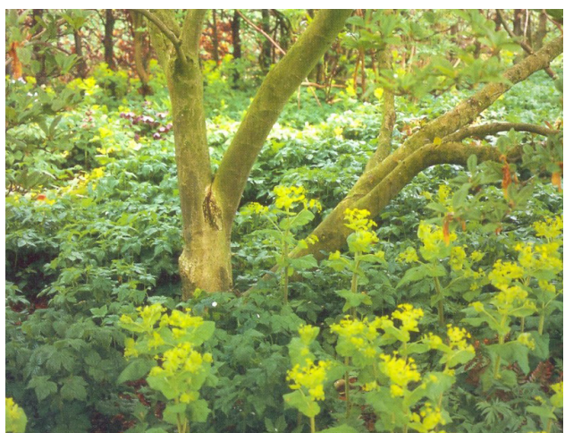
Inspiration til den fremtidige gårdhave