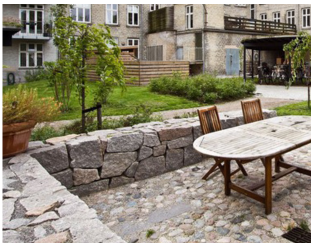
Inspiration til den fremtidige gårdhave