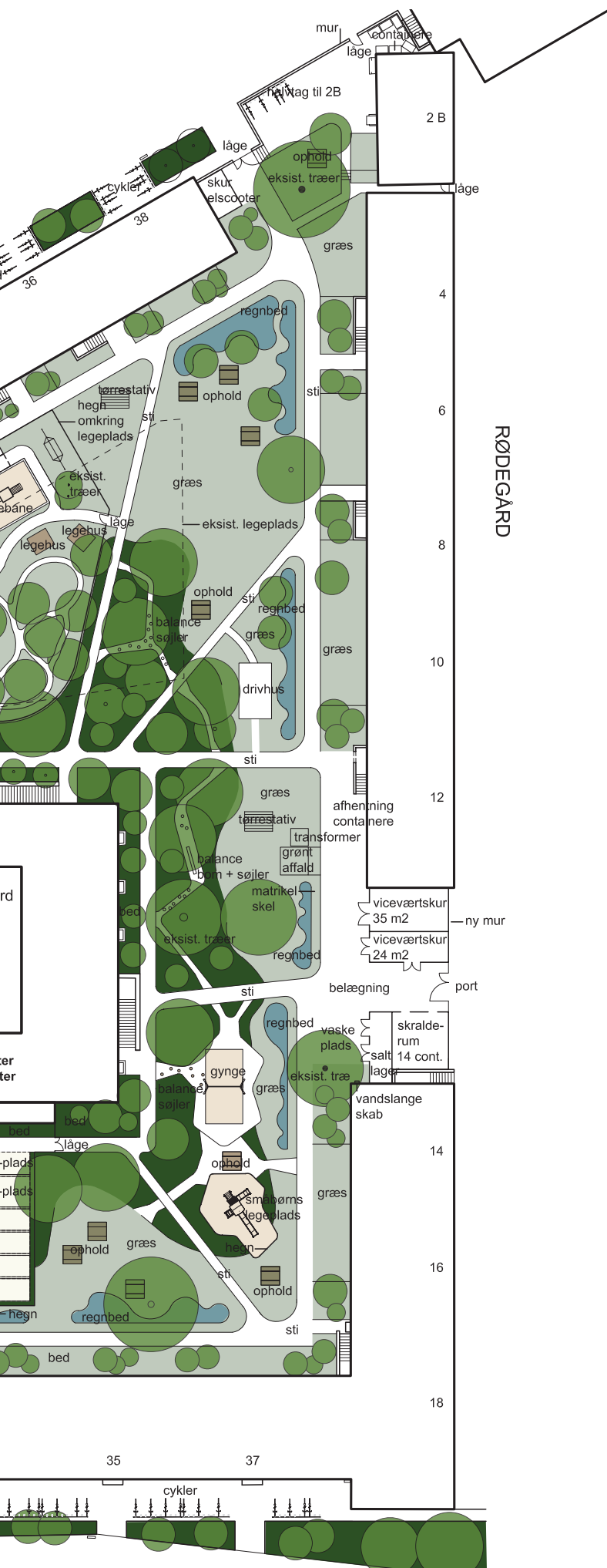
Rødegårds-karreen Forslag til indretning af fælles gårdhave