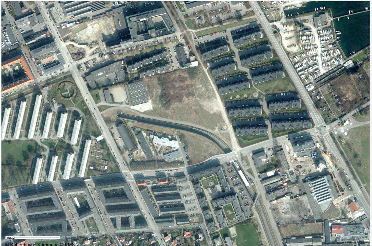
Loftfoto af 2012 med bl.a. parkeringsarealer i lokalplanområde nr. 346