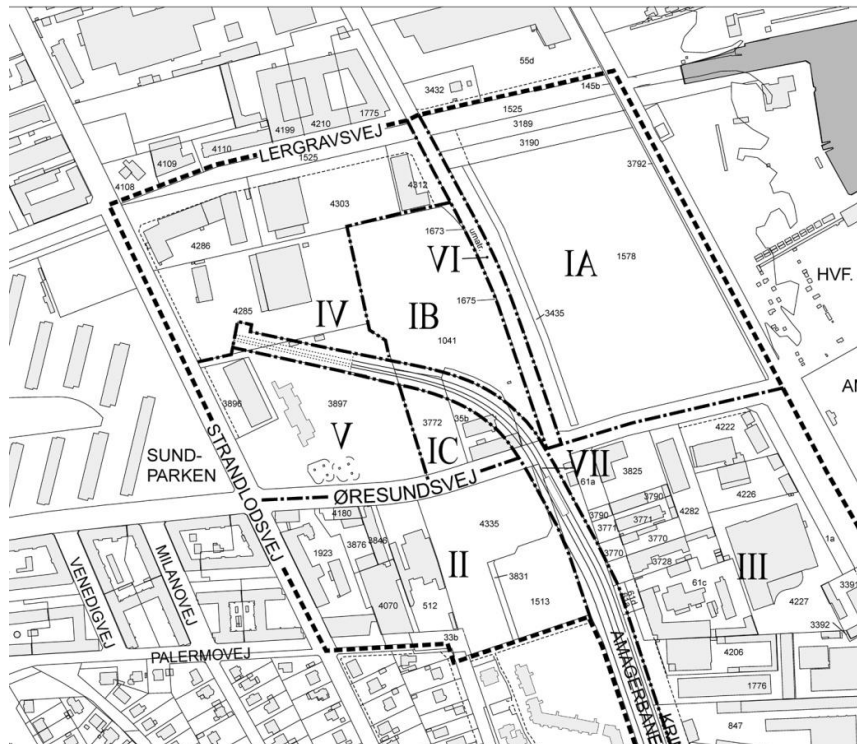
Underområder i lokalplan nr. 346

Parkeringsdækningen i det aktuelle område ved Lergravsvej skal ifølge den gældende lokalplan nr. 346 være af størrelsesordenen én parkeringsplads pr. 100 m 2 etageareal. Området fremgår af kortet ovenfor.