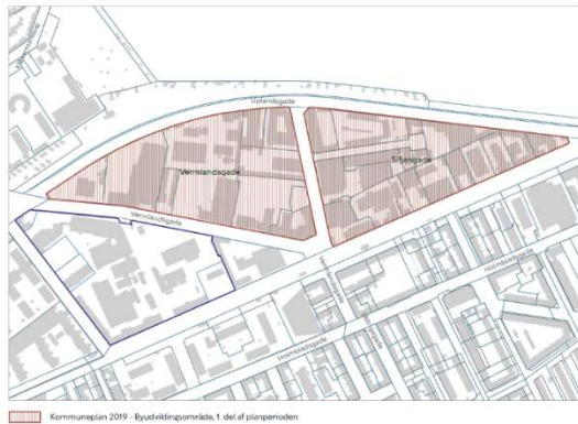
Kommuneplan 2019 - Byudviklingsområde, 1. del af planperioden