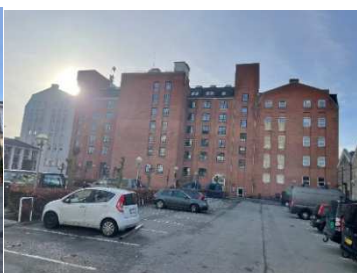
Vermundsgade 38C, E, H og F