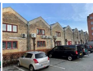
Vermundsgade 40A (baghus)