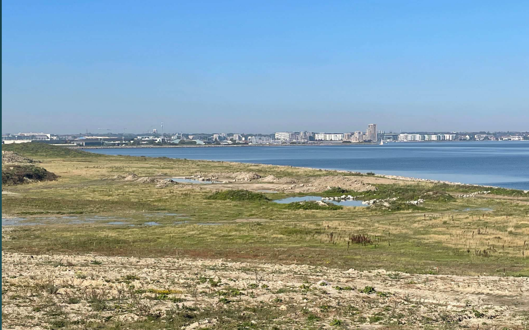
Sletten mellem højene i naturparkområdet set mod syd