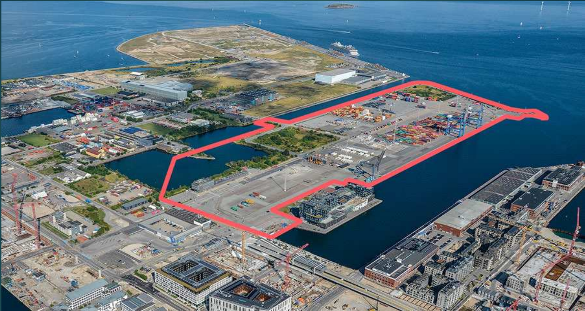
Området for det kommende byggeri Levantkaj