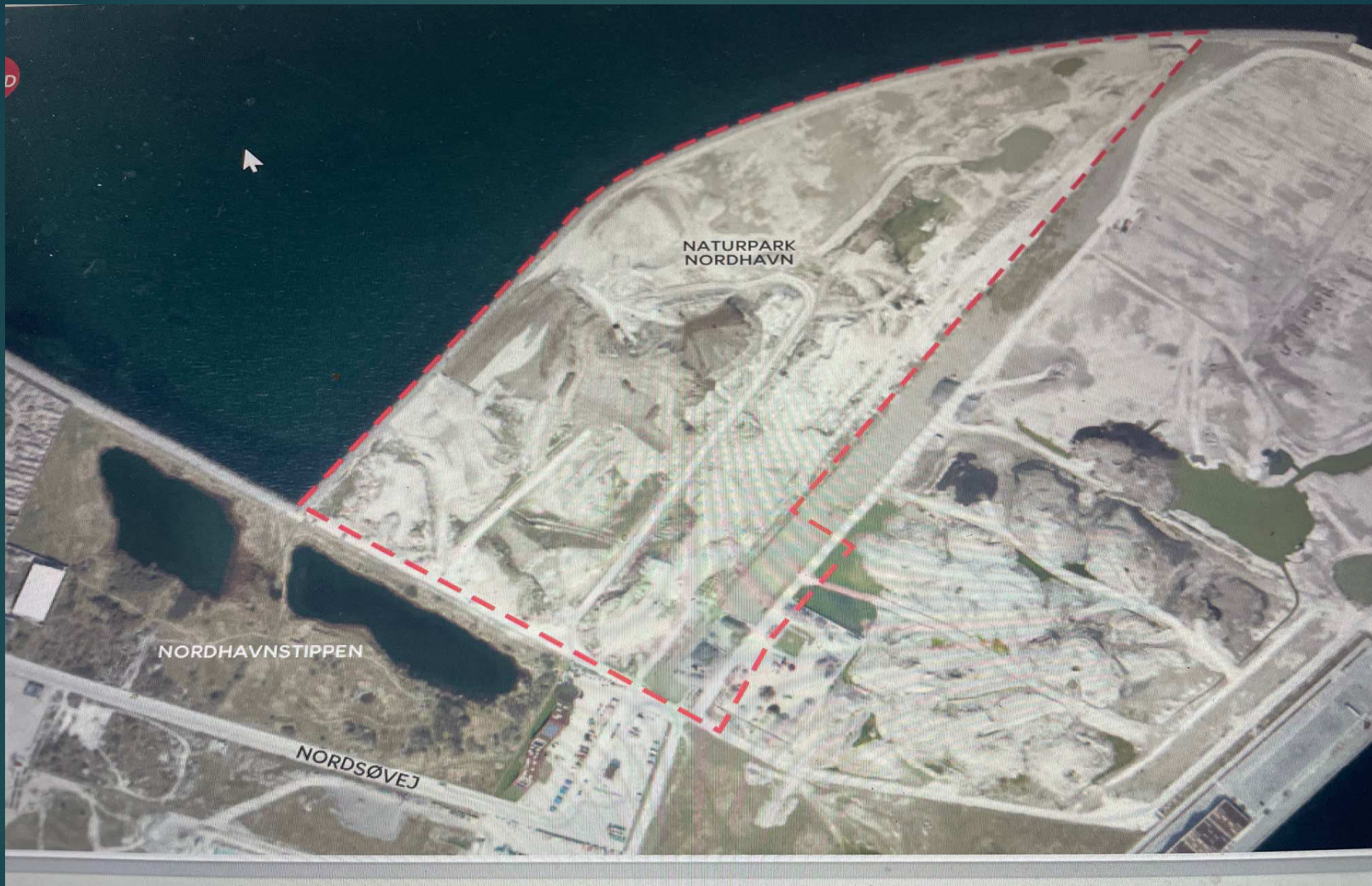
Oversigt over arealer til containerhavn og Naturpark Nordhavn til højde 28 Ha