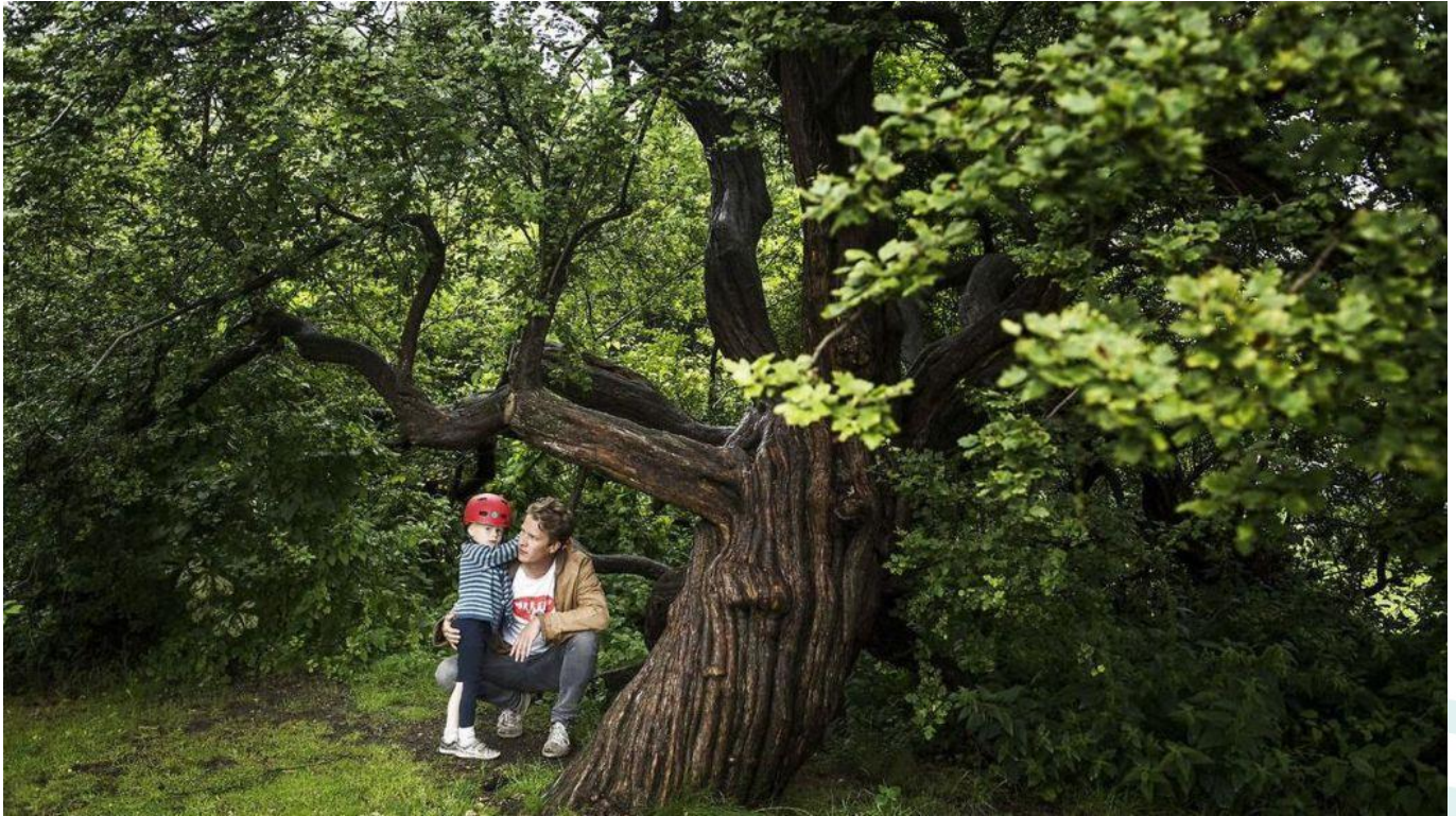
Nørrebros ældste træ, en Hvidtjørn på 'Nordpolen' i De Gamles By, har stået her siden før Nørrebro blev bygget