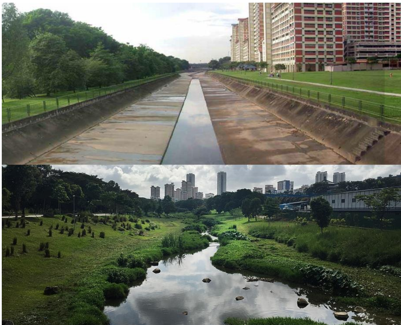
Singapore Bishan Park før og efter skybrudspark blev lavet. Dette kunne være en model for Bispeengen // klimatilpasning.dk