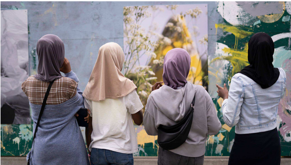
Fire unge kvinder betragter deres nye fotoudstilling, Tingbjerg, juni 2021

Bikubenfonden Boligselskaberne KAB og FSB Den Boligsociale Helhedsplan Nørrebro Roskilde Festival Socialstyrelsen Statens Kunstfond U-Turn m.fl.