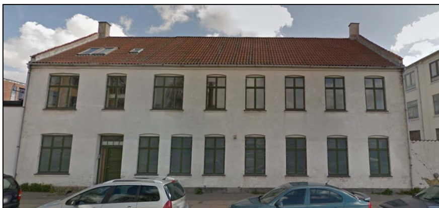
Den eksisterende bygning på adressen Strandlodsvej 3, der er søgt om dispensation til nedrivning af.