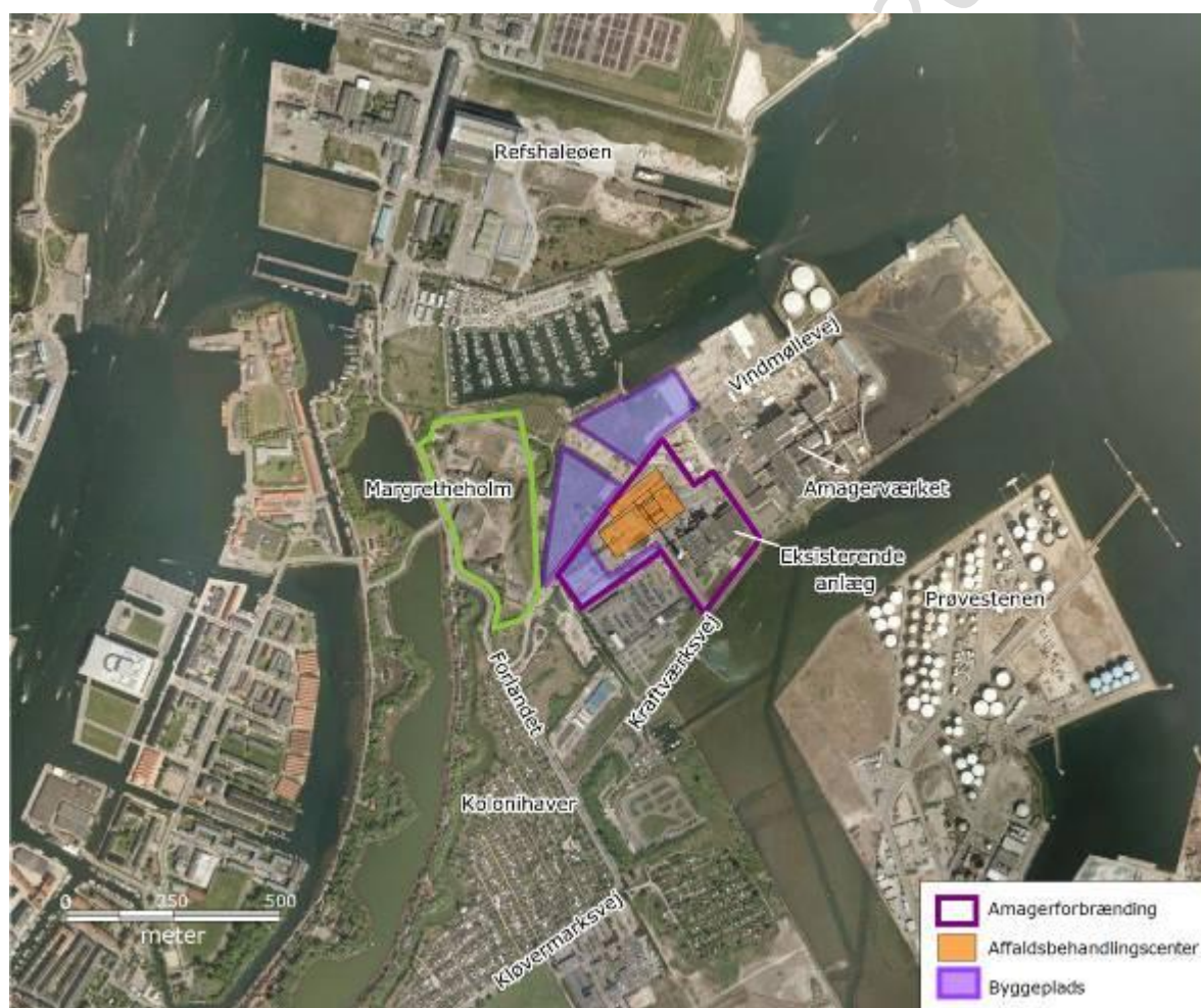
Figur 1-1 Amagerforbrændings nye affaldsbehandlingscenter, byggeplads samt omgivelser.

Affaldsforbrændingsanlægget etableres i perioden 2012-2016, mens sorteringsanlægget først forventes etableret i 2018. I takt med at det nye affaldsforbrændingsanlæg sættes i drift, vil driften af det eksisterende anlæg blive udfaset og den eksisterende bygning blive revet ned. Amagerforbrænding ønsker ligeledes at bygge et demonstrationsanlæg til raffinering af husholdningsaffald (benævnt REnescience) i den eksisterende bygning. Demonstrationsanlægget forventes at skulle være i drift i perioden 2013 til nedtagning af den eksisterende bygning. Et kommercielt REnescienceanlæg kunne komme til at indgå som et element i sorteringsanlægget, hvorfor dette i VVM-redegørelsen også er medtaget i virkningerne på miljøet af sorteringsanlæggets driftsfase.