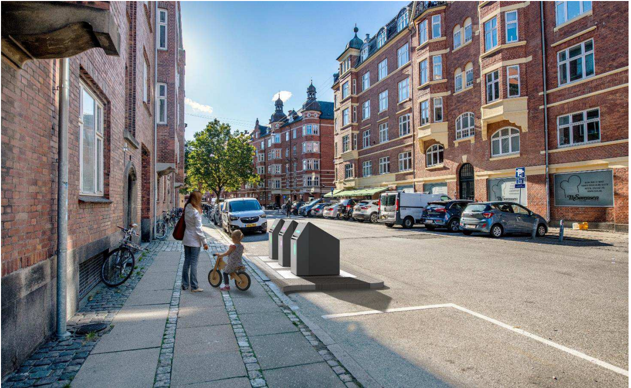
Eksempel på sorteringspunkt med tre nedgravede beholdere. Placering samt udformning af affaldsløsninger og anlæg er ikke nøjagtig gengivelse af hvordan et sorteringspunkt kommer til at fremstå.