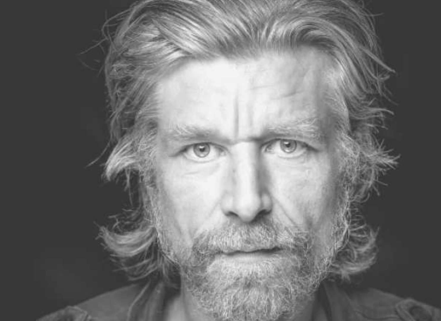
KARL OVE KNAUSGÅRD