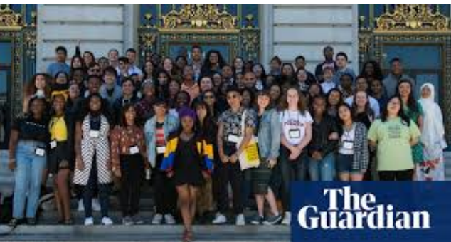
100 unge samlet i San Francisco 2018

BESKRIVELSE I august 2020 er Ordskælv vært for den årligt tilbagevendende International Congress of Youth Voices (ICYV), som samler unge fra hele verden til en uge, hvor de udvikler på de ideer de har til skabe forandring i verden. ICYV blev lanceret af vores søsterorganisation i San Francisco i 2018, hvor 100 unge aktivister fra hele verden (heraf to fra Ordskælv) samledes i San Francisco med anerkendte gæstetalere – herunder US representative John Lewis og forfatter Chimamanda Ngozi Adichie – til inspiration og samskabelse. I år afholdes ICYV i Puerto Rico og i 2020 i København med Ordskælv som vært.