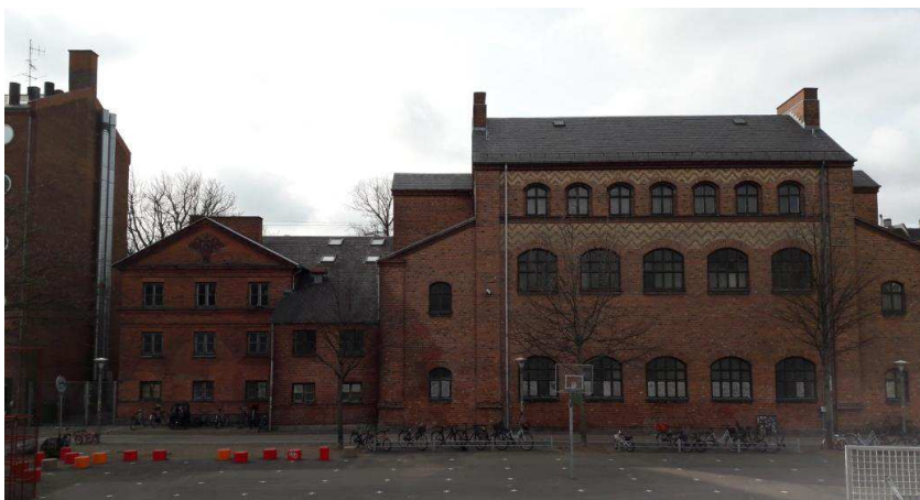
Til venstre den gamle badeanstalt (SAVE 3), der foreslås nedrevet, og til højre den gamle gymnastikbygning (SAVE 3), der foreslås bevaret.

Idet badeanstaltsbygningen er registreret med høj bevaringsværdi, har Teknik- og Miljøforvaltningen foretaget en konkret vurdering af de foreliggende omstændigheder forud for, at der med lokalplanforslaget gives mulighed for nedrivning.