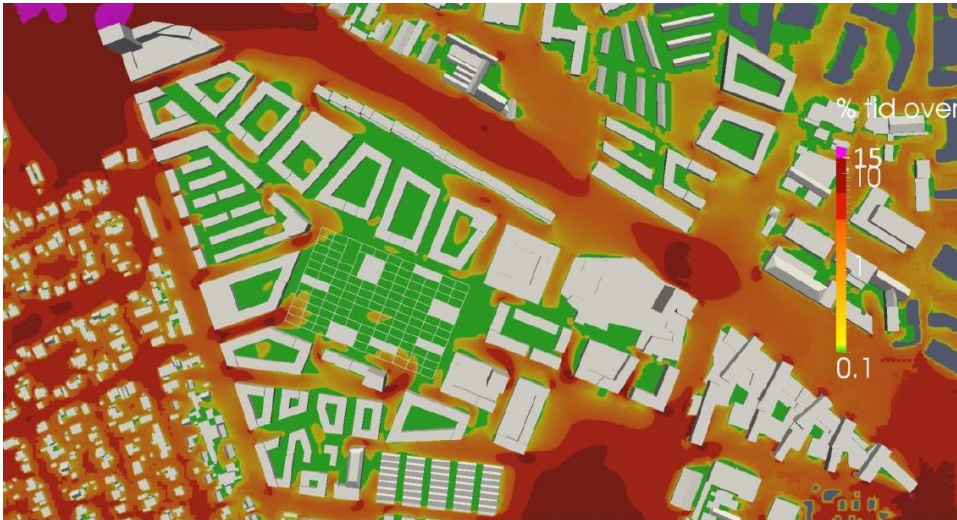
Figur 2. Vindforhold for området, beregnet uden lægivende foranstaltninger. Uddrag af vindanalyse udarbejdet af Vind-vind ApS, dateret 2014.11.05. Skalaen angiver den procentuelle andel af tiden, hvor vinden overstiger 6 m/s. Et miljø med 0,1 % tid over 6 m/s anses for acceptabelt til udeophold af længere varighed, mens 6% anses for acceptabelt til kortere ophold, 23 % til slentring og 43 % til hurtig gang.

Hvis man sammenholder områder, hvor der placeres højhuse og steder med aktive facader ser det ud til at være et sammenfald nogle steder.