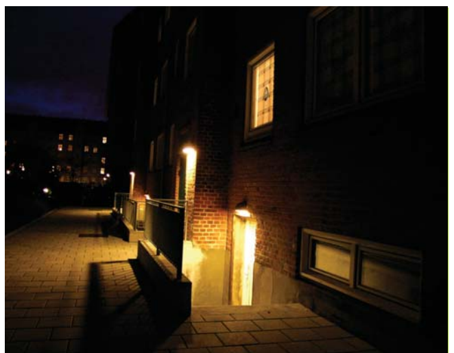
Inspiration til den fremtidige gårdhave