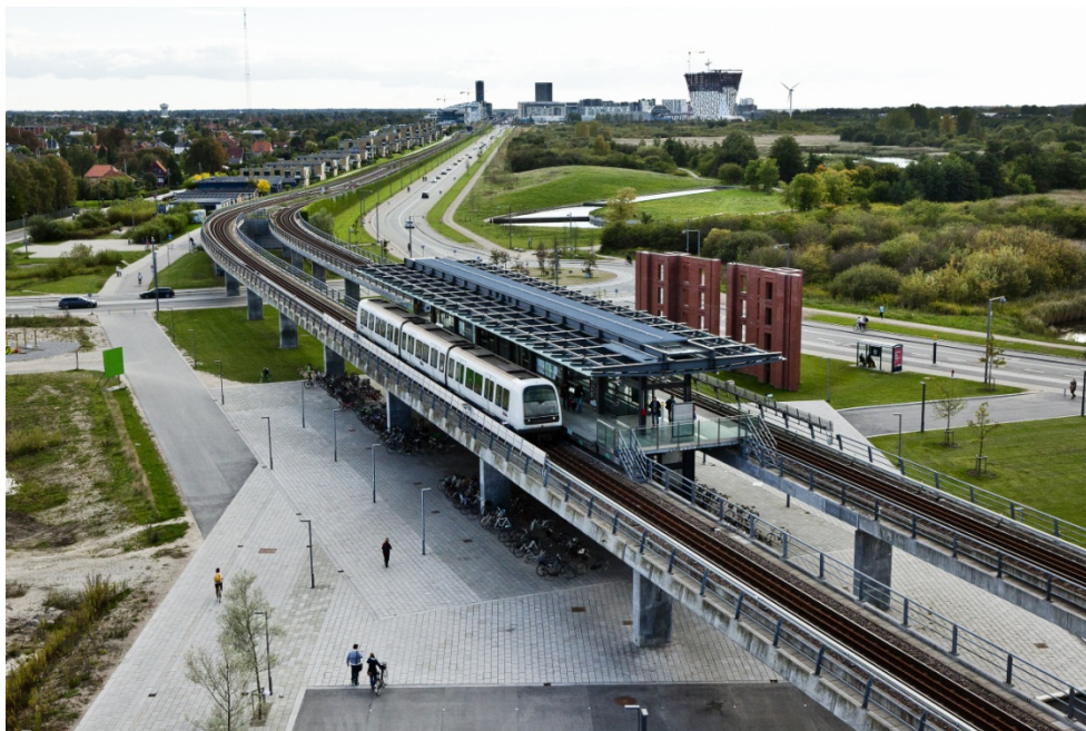
Figur 1.3 Endestationen ved Orientkaj vil blive udført som en højbanestation. Det viste eksempel er fra DR-byen station.

Endestationen ved Orientkaj vil blive udformet som en højbanestation og forberedt med mulighed for senere udbygning af Nordhavnsmetroen.