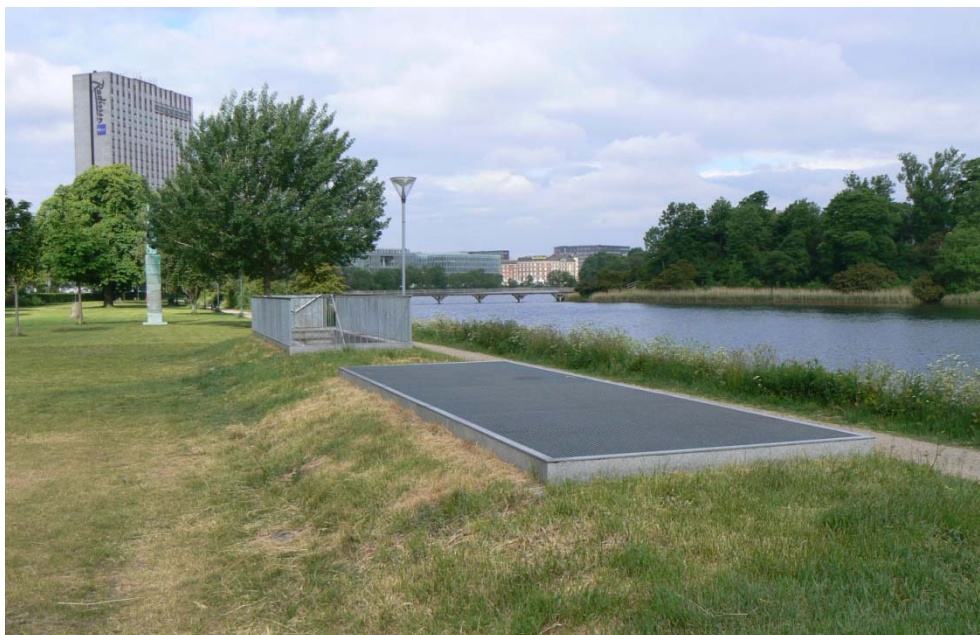
Figur 1.4 Eksempel på ventilationsrist og trappe til skakt. Det viste eksempel er fra Enve-loppeparken ved Stadsgraven.