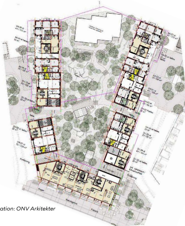
Stueplan. Illustration: ONV Arkitekter