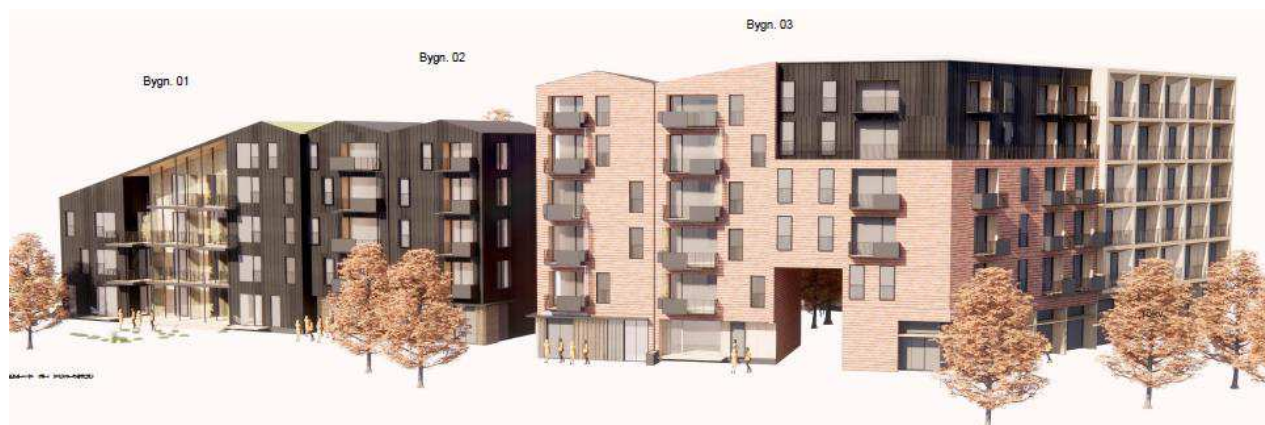
Bebyggelsen set fra vestgaden. Illustration: ONV Arkitekter