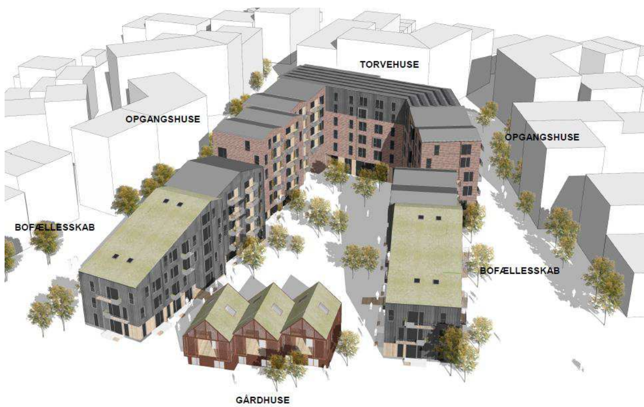
Bebyggelsen set fra fælleden. Illustration: ONV Arkitekter