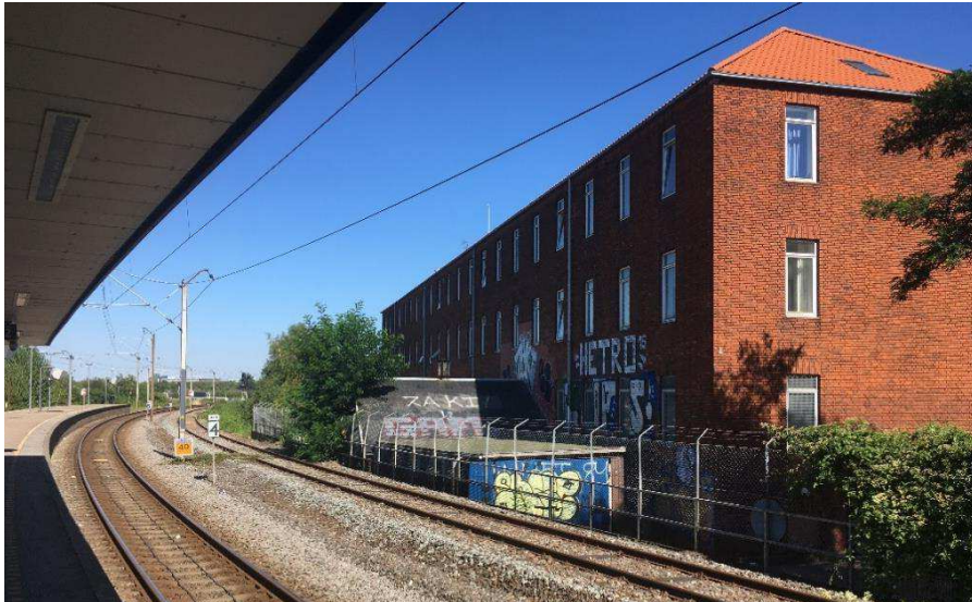
Bebyggelse set fra Ryparken Station.