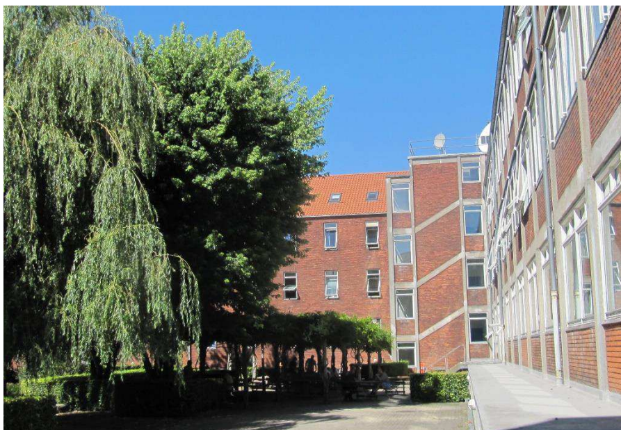
Gårdhaver med udsyn til trappetårn (lige fremme) og værkstedsfløj (til højre).