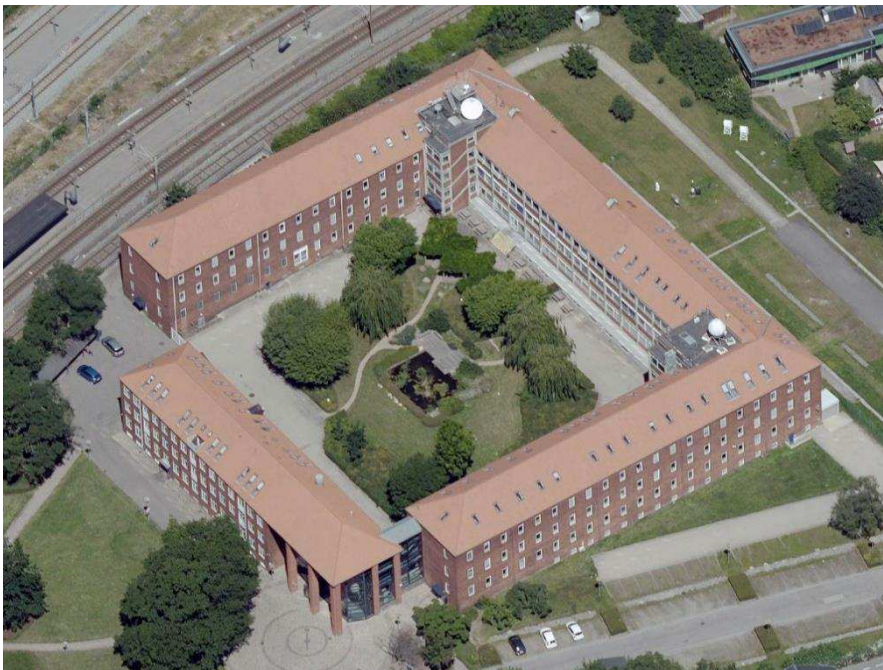
Skråfoto som viser eksisterende bebyggelse på Lyngbyvej 100.