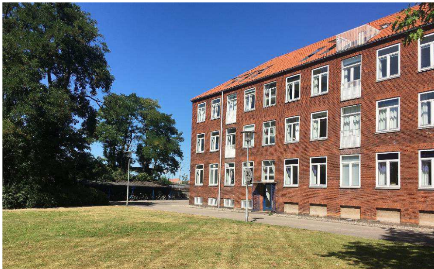
Administrationsfløj mod vest, med røde tegl og hvide vinduer.