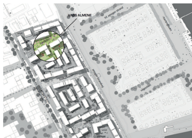
Almene boligers placering