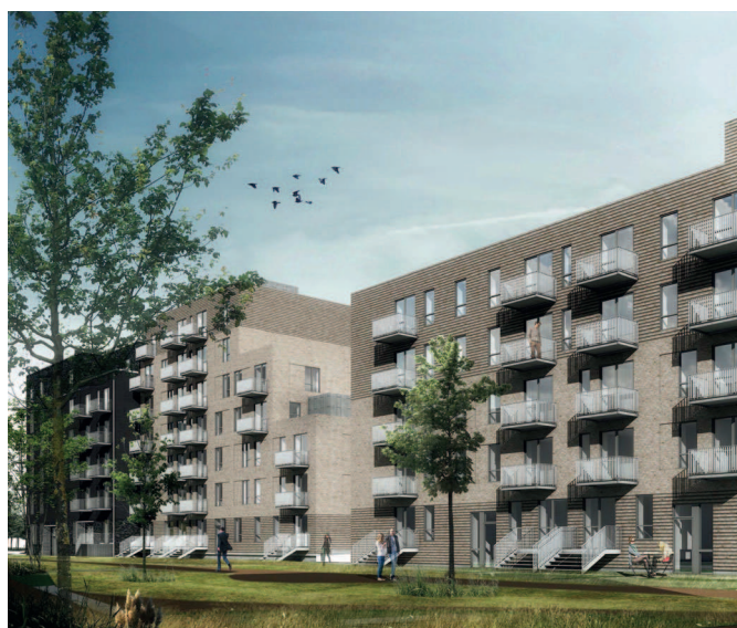
Illustration af bebyggelsen set fra nord