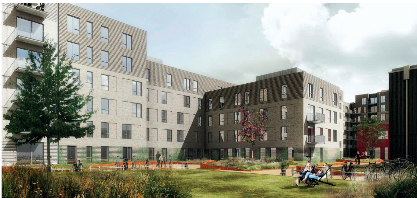
Illustration af gårdmiljø set fra syd